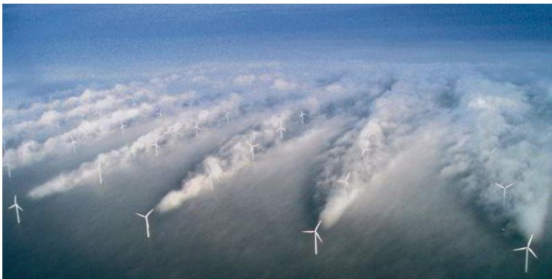
Wolken kunnen achter windturbines ontstaan zoals in de Horns Rev windpark in Denemarken.

11. Er kan sprake zijn van beïnvloeding van het weer: door turbulentie van achter elkaar draaiende turbines worden hogere en lagere luchtlagen gemengd, waardoor op grondniveau meer wind, warmte en wolken kunnen ontstaan.