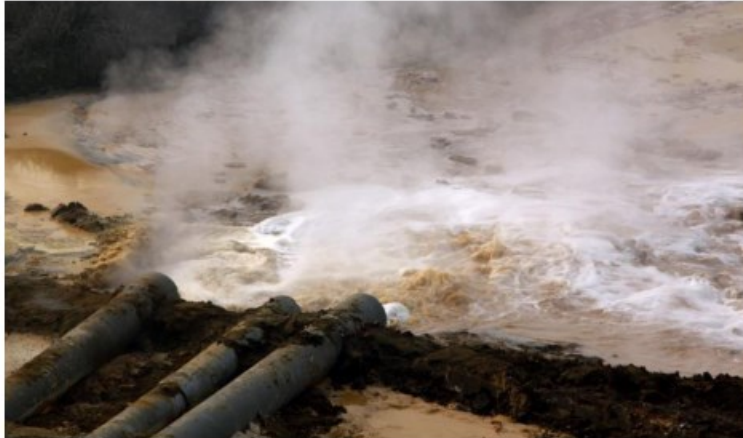
Waterverontreiniging in Baotou.

8. Ruim 90% van alle neodymium magneten komen nu uit China. De kans dat China een grondstoffen-importboycot instelt tegen Europa wordt geschat op meer dan 50% in de komende tien jaar. Daarmee is er geen zekerheid voor de nieuwbouw en vervanging van windmolens.