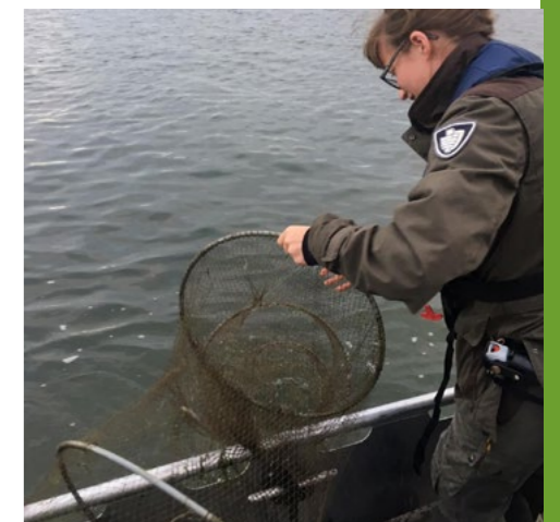
ODBN Kadernota 2021

Bij een vergunningaanvraag op grond van de Wet algemene bepalingen omgevingsrecht (Wabo) waarbij ook als onderdeel de Wet natuurbescherming is aangevraagd hebben gemeenten ook een rol bij de Wet natuurbescherming. Bij activiteiten met mogelijk negatieve effecten op wettelijk beschermde dier- en plantensoorten