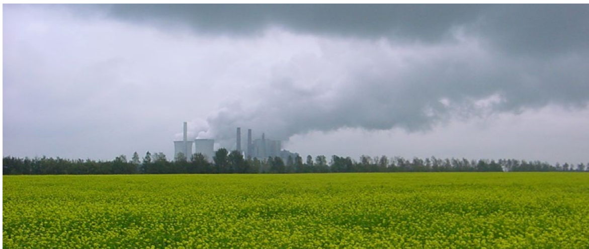
Samen werken aan een schone en veilige leefomgeving, nu en in de toekomst

Om de verbeterdoelen van de Omgevingswet te behalen en de digitale samenwerking te bevorderen, wordt het Digitale Stelsel Omgevingswet (DSO) door het Rijk ontwikkeld. Het DSO bundelt en ontsluit informatie die bij de diverse partners aanwezig is. De ODBN treft in 2019 en 2020 de voorbereidingen om aan te kunnen sluiten op het DSO en dit zal in 2021 en verder zijn uitwerking krijgen.