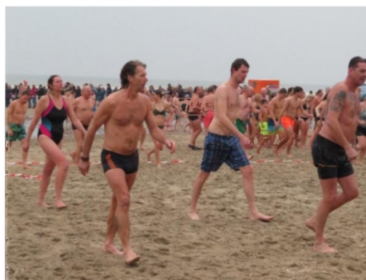
Gespot, een Heijer bij de Nieuwjaarsduik