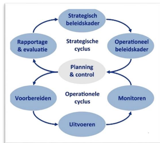
Figuur 1 Big 8

Het proces vergunningverlening, toezicht en handhaving is aan wettelijke regels gebonden. In het Omgevingsbesluit zijn wettelijke onderwerpen benoemd die betrekking hebben op de invulling van VTH beleid (nieuwe term: U&HS). Naast de verplichte onderwerpen staan er in het PUH ook taken met betrekking tot APV en Bijzondere Wetten opgenomen. Centraal in het Omgevingsbesluit staat de cyclische benadering van de U&HS. Deze beleidscyclus staat in Figuur 1 weergegeven en wordt ook wel de Beleidsacht of BIG 8 genoemd. De BIG 8 geeft inzicht in het cyclische gedachtegoed van de wettelijk vastgestelde kwaliteitscriteria voor de vergunningverlening, toezicht- en handhavingstaken (VTH). De strekking van dit programma heeft met name betrekking op de onderste cyclus (de operationele cyclus). De U&HS heeft betrekking op de bovenste cyclus (strategische cyclus).