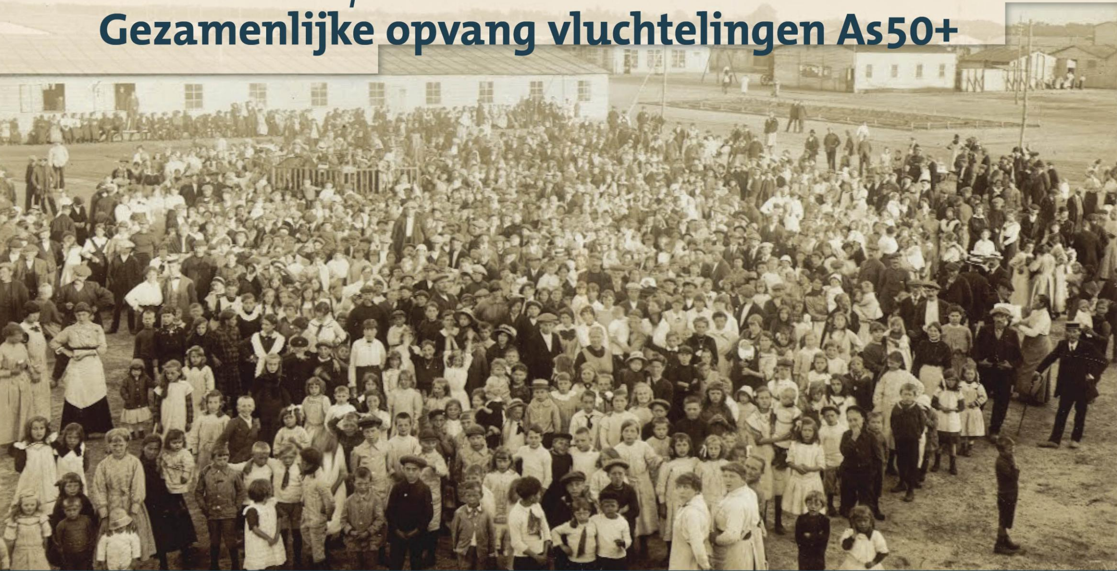
Belangstellende Belgische vluchtelingen in Vluchtoord Uden 1915-1918.