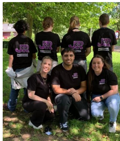
Foto: staand aantal leden van de Jongerenraad van Combinatie Jeugdzorg met op de voorgrond de ondersteuners van de Jongerenraad. De t-shirts met een door henzelf ontworpen logo zijn geschonken door een fonds dat graag anoniem wil blijven.

Op woensdag 5 juni was de Jongerenraad van Combinatie Jeugdzorg aanwezig bij de landelijke dag van het Jeugdwelzijnsberaad. De dag begon met een Lagerhuisdebat waarin de jongeren stellingen bespraken over veiligheid op de groepen, duur van trajecten en groepsdynamiek. Het was indrukwekkend om te zien hoe bevolgen en betrokken iedereen was. De uitwisseling van meningen en ideeën heeft ons allemaal aan het denken gezet en geïnspireerd om gezamenlijk te werken aan een veiliger en beter jeugdzorgsysteem. Uiteraard was er ook tijd voor ontspanning en creativiteit in diverse leuke workshops, waaronder graffiti en singer/songwriter. Het was mooi om te zien hoeveel talent de jongeren in hun mars hebben. De workshops boden niet alleen een kans om nieuwe vaardigheden te leren, maar ook om op een andere manier met elkaar in contact te komen en samen te werken. Een van de hoogtepunten van de dag was ongetwijfeld de stormbaan. Jongeren en begeleiders daagden elkaar uit en moedigden elkaar aan terwijl ze zich een weg baanden door de obstakels. Deze dag was niet alleen een mooie gelegenheid om samen te komen met Jongerenraden uit het hele land, maar ook om ervaringen te delen, van elkaar te leren en nieuwe contacten op te doen. We hebben erg genoten en kijken al uit naar het volgende Jeugdwelzijnsberaad in 2025.