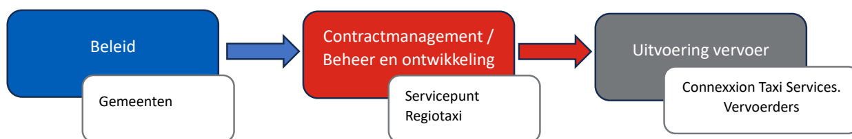
Figuur 1: Organisatie vervoer