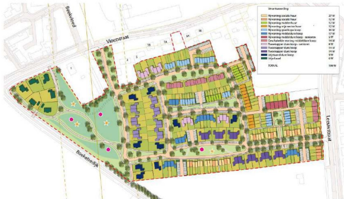
Figuur 1.2: Verkavelingsplan nieuwbouwontwikkeling (bron: Urban Jazz)

Het akoestisch onderzoek is uitgevoerd om inzicht te geven in de geluidemissie van de activiteiten Wassenberg Volkel aan de Leeuwstraat 1 te Volkel. De optredende gevelbelastingen zijn daarnaast getoetst aan de eisen uit het Activiteitenbesluit milieubeheer en de VNG op de gevels van de meest nabij gelegen te ontwikkelen woningen.