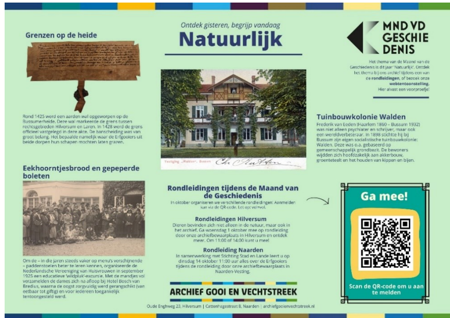
Poster voor de Maand van de Geschiedenis

In Hilversum stonden twee rondleidingen op het programma voor het brede publiek. Daarnaast ontvingen we leerlingen van De Klimop gespecialiseerd (voortgezet) onderwijs, en hebben collega's van Gooise Meren, Hilversum, Wijdemeren, Blaricum en Laren tijdens de Maand van de Geschiedenis eveneens nader kennis kunnen maken met Archief Gooi en Vechtstreek.