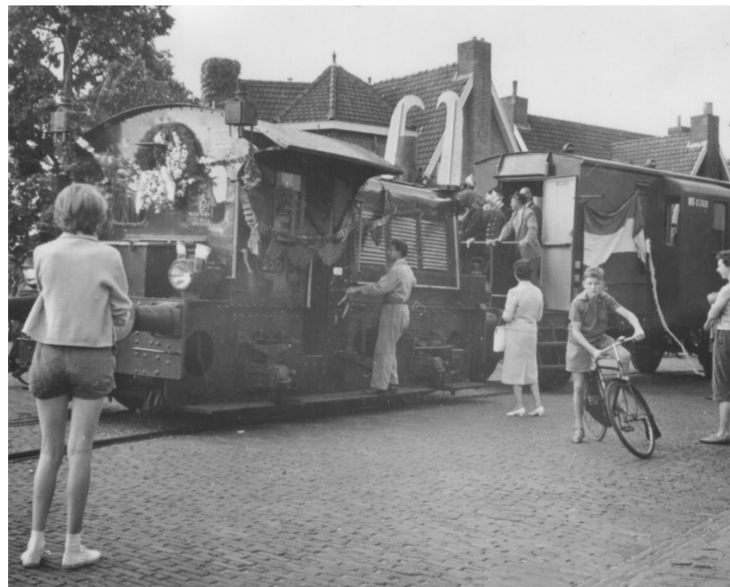
Laatste rit van de "Gooische Stoomtram" met de SIK van Naarden naar Bussum op 31 juli 1958. (SSAN092W+S4.078.1)

Evenals vorig jaar hebben we de bewoners en personeel van zorgvilla Koetshuys Erica in Hilversum foto's laten zien uit de historie van 't Gooi en de Vechtstreek. Onder meer de Gooische Stoomtram, het raadhuis van Dudok en schaatsen op de Coeswaerde in Laren passeerden de revue.