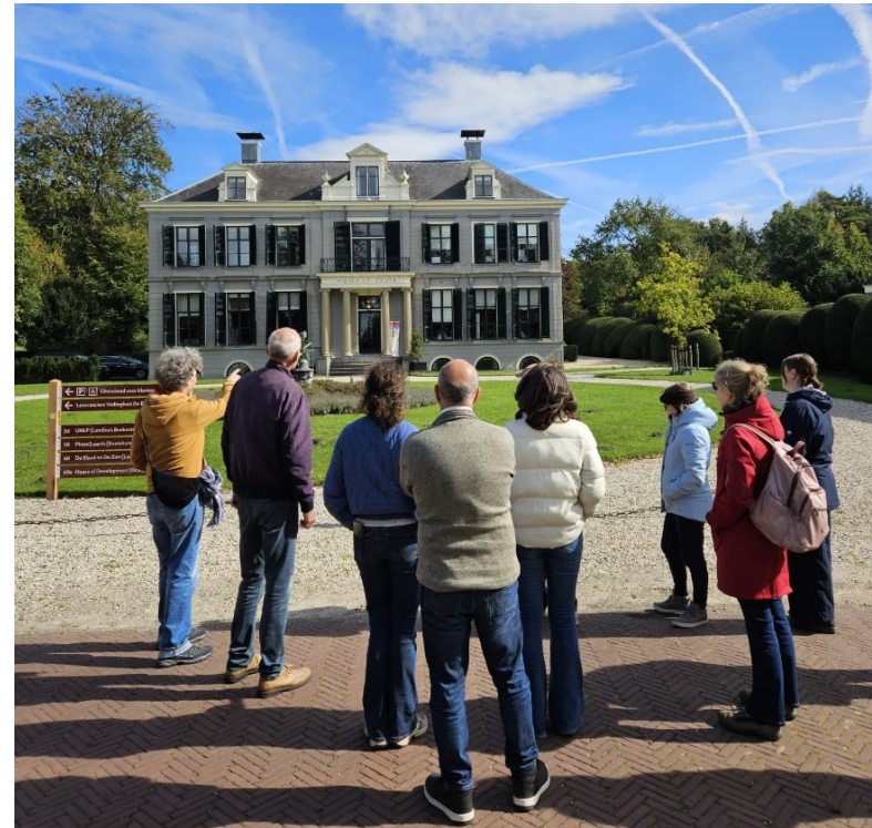
Teamdag 2025: rondleiding op de buitenplaatsen van 's-Graveland

tekstherkenning bij handschriften) en een cursus over het herkennen en behandelen van schimmel en ongedierte in papieren archieven.