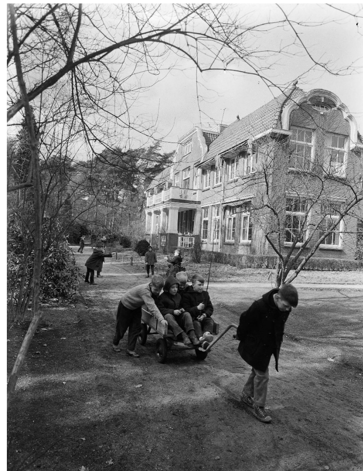
Kinderen bij het astmacentrum Bosch en Heide in Blaricum in 1954. Uit het archief van Jacques Stevens (SAGV032.7+10191)