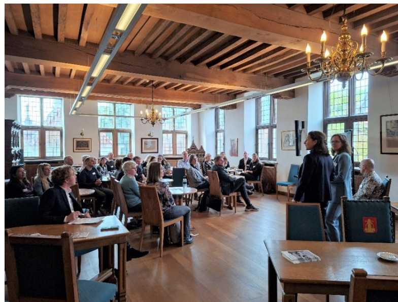
Kennismiddag in oktober 2025 in samenwerking met RHC Vecht en Venen in het Oude Stadhuis van Naarden

Er was veel belangstelling voor beide kennismiddagen, en de samenwerking met onze naaste burens in archievenland werd als positief, interactief en leerzaam ervaren.