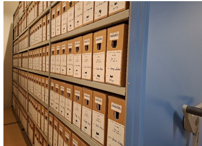
Archiefbewaarplaats in Hilversum

De bezoekers hebben in totaal 3.857 archiefstukken op beide studiezalen geraadpleegd. Dit aantal ligt aanzienlijk lager dan in 2024; de afname van bijna 22% is mede te verklaren doordat steeds meer archiefstukken digitaal beschikbaar worden gesteld.