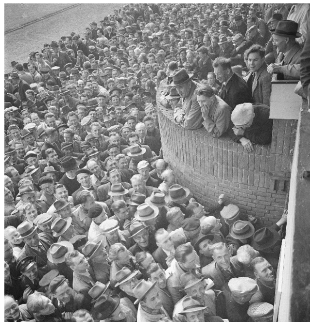
Drommen mannen naar uitgang onder de tribune van het Sportpark na de vergadering van de Vereniging van Stad en Lande. Uit het archief van Jacques Stevens (SAGV032.7+7378)

Ook het geactualiseerde Portfolio Producten en Diensten is in de najaarsvergadering voorgelegd, alsmede de nieuwe documenten inzake het overdrachtsprotocol voor het e-depot en de bijbehorende aanlevervoorwaarden.