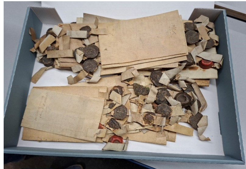
Bijzondere aanvulling 17 e -eeuwse eigendomsakten uit het archief Familiestichting J.P. van Rossum (SSAN026)

Van de gemeente Wijdmeren ontvingen we in december meerdere jaargangen van weekbladen van Wijdmeren en rechtsvoorgangers.