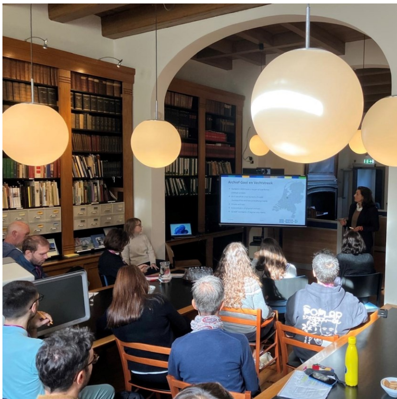
Bezoek Italiaanse delegatie van erfgoedprofessionals in Naarden