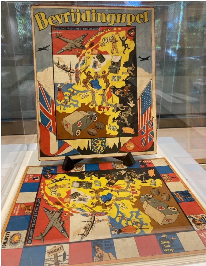
Een Bevrijdingsspel uit de Collectie Hilversum werd geplaatst in de vitrine van de studiezaal van Hilversum rondom 4 en 5 mei