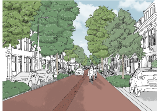
Schets van de Willem van Noortstraat nu en het nieuwe ontwerp.