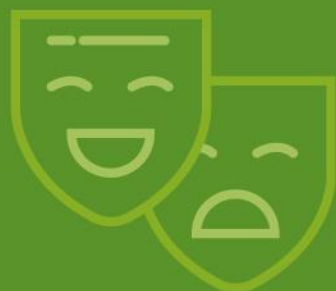
Kunst & Cultuur