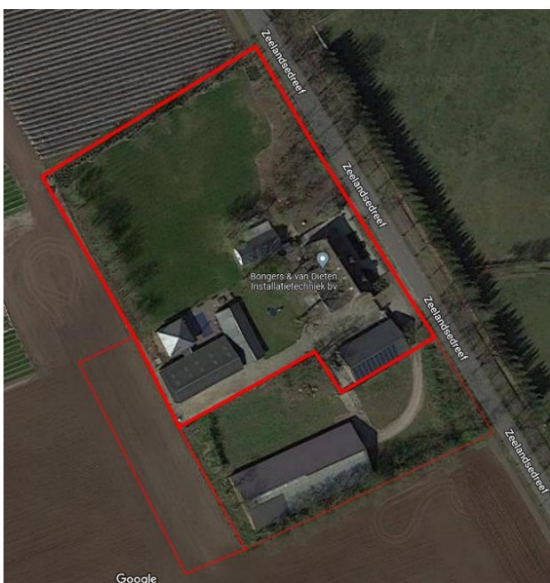
Plangebied en verdeling eigendommen

Aan de zuidzijde valt een deel van het voormalige bouwblok op gronden die inmiddels in gebruik zijn als agrarische percelen en initiatiefnemer voornemens is deze als zodanig te bestemmen.