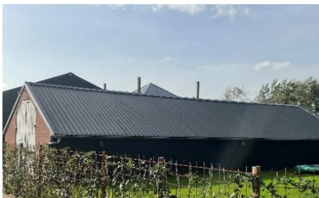
Bedrijfsgebouwen op erf