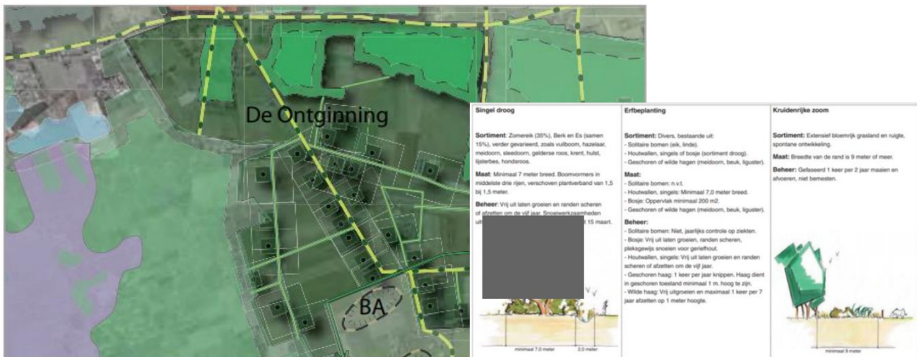
Afbeelding verbeeldt de maatregelen voor deelgebied 'De ontginning'