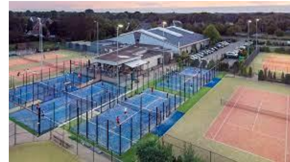
Mariaheide (15 banen + binnenbanen)