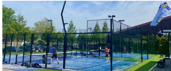
Beek en Donk (3 banen + gesprekken over 4 extra banen)