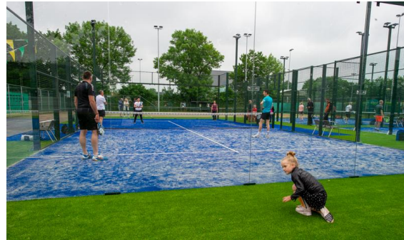
Gemert (6 banen + 3 binnen)