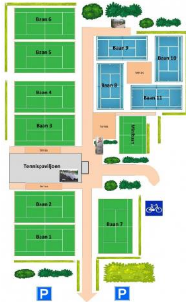
Erp (4 banen)