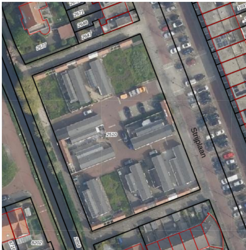
Afbeelding: Luchtfoto woonwagenlocatie De Strijp