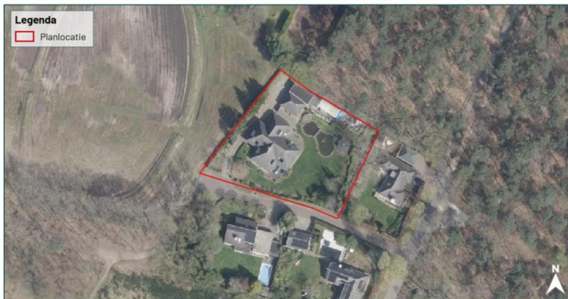
Figuur 1.2 De planlocatie (rood omkaderd) is gelegen aan de Dirck van den Hornelaan 21 te Waalre.

De planlocatie is gelegen aan de Dirck van den Hornelaan 21 te Waalre (figuur 1.2). Het betreft een perceel met een woning en enkele bijgebouwen en een groene tuin met vijver. De beoogde woning zal worden gerealiseerd op het grasveld in het zuidoostelijke deel van het plangebied. In figuur 1.3 en bijlage 1 zijn een aantal foto's opgenomen die een impressie geven van de planlocatie en de directe omgeving hiervan.