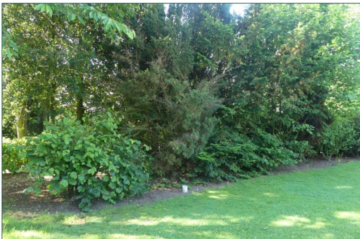
Figuur 2 De tuin op de planlocatie is onderhouden met een hoog kwaliteitsbeeld. De groenstructuren op de planlocatie blijven behouden.