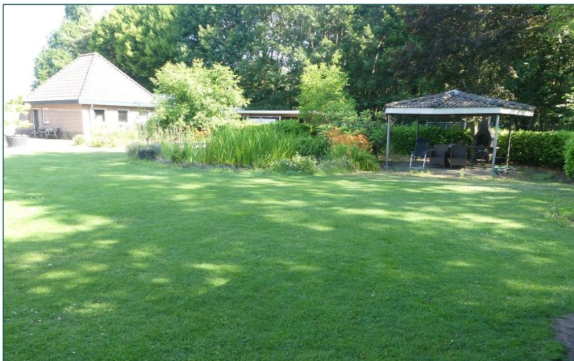
Figuur 1 De planlocatie is gelegen aan de Dirck van Hornelaan 21 te Waalre en bestaat uit een woonperceel met woning, enkele bijgebouwen, een vijver en ruime groene tuin. De beoogde ruimtelijke ingreep betreft het splitsen van de kavel ten behoeve van realisatie van een woning op het grasveld.