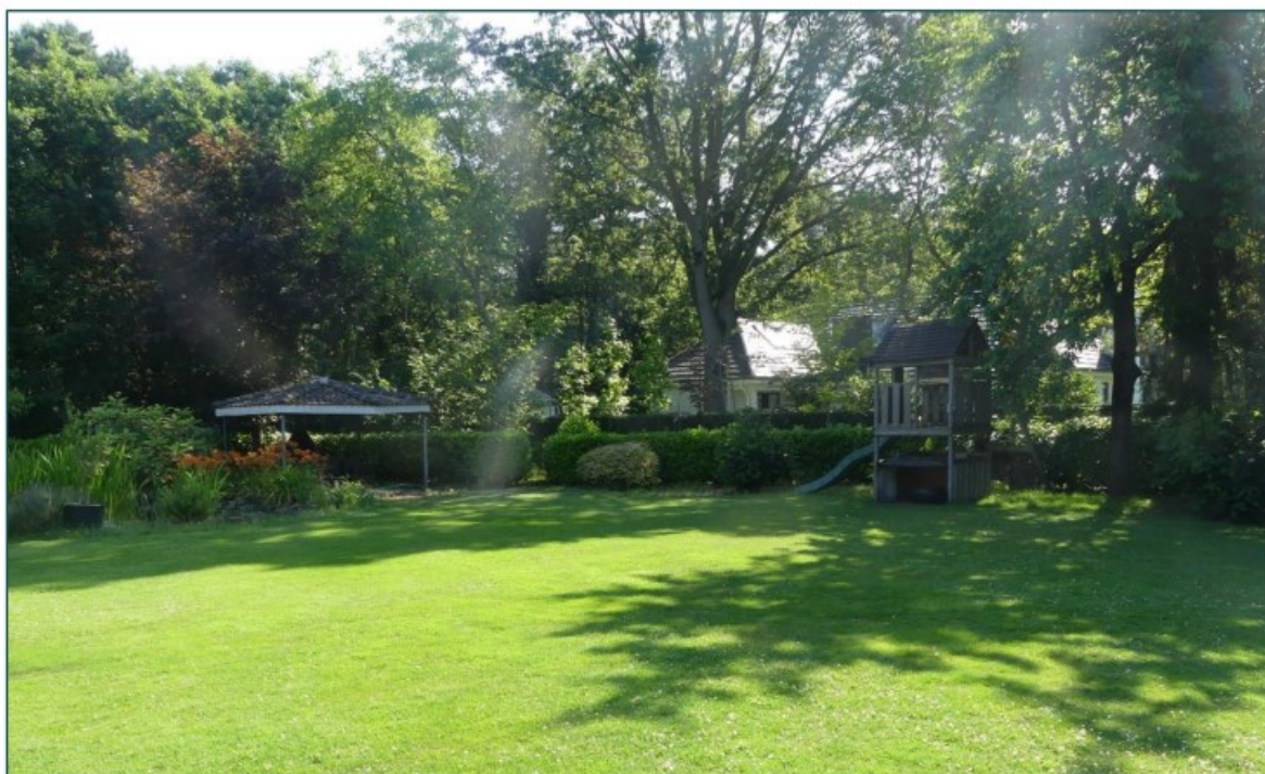
Figuur 1.1 De planlocatie is gelegen aan de Dirck van den Hornelaan 21 te Waalre.