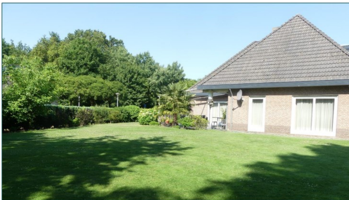
Figuur 1.3 Op de planlocatie is men voornemens om de kavel te splitsen en op het grasveld naast de woning een woning te realiseren.

De directe omgeving van de planlocatie wordt gekenmerkt door een buitenwijk van Waalre met vrijstaande woningen en een bosrijk buitengebied. Ten westen van de planlocatie ligt een braakliggend gebied waar men voornemens is woningen te realiseren. De planlocatie grenst aan een bosrijk gebied. Op een afstand van circa 370 m is een grote waterplas gelegen en op een afstand van circa 1,2 km ligt de A67.