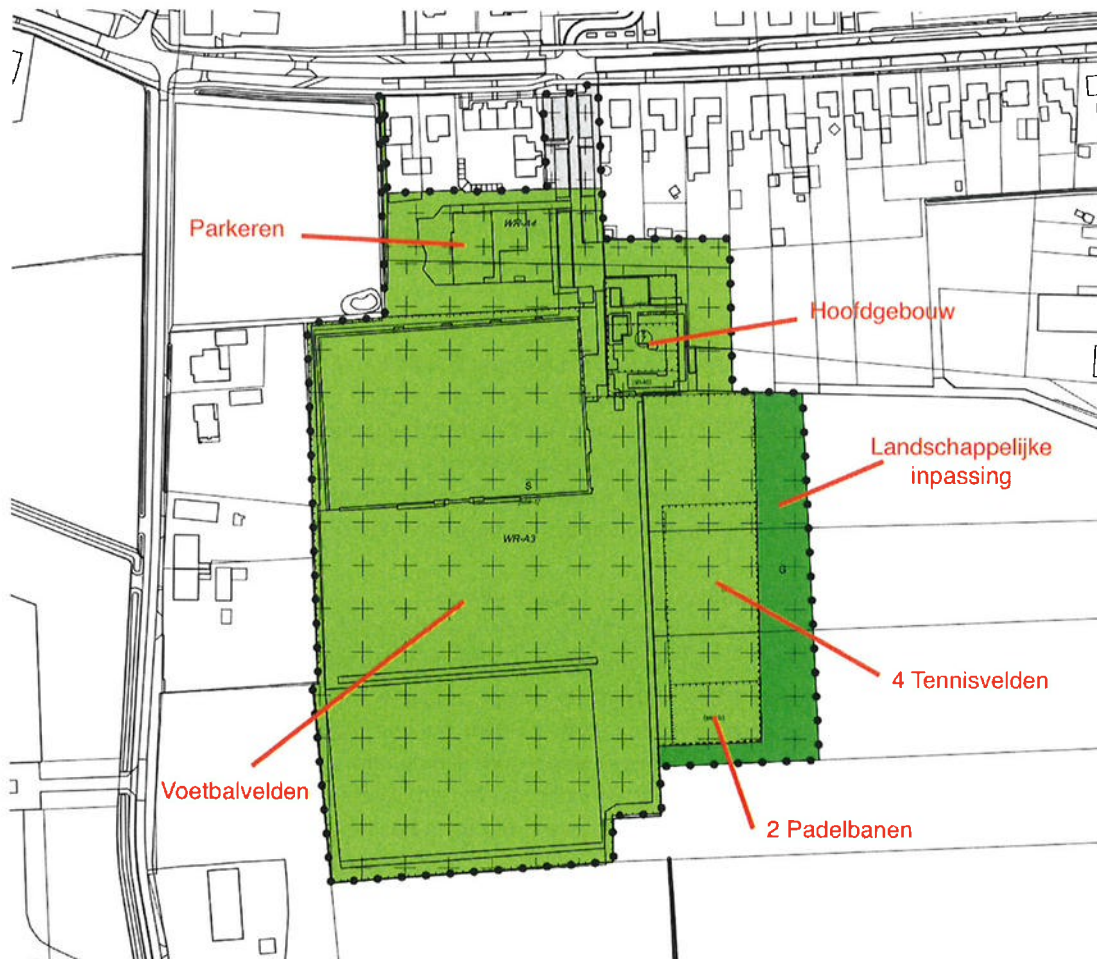
Figuur met indeling nieuwe ontwerpbestemmingsplan Sport en Spel 2024

Er wordt op deze wijze zoveel als mogelijk tegemoetgekomen aan de zienswijzen vanuit de omgeving die in 2021 zijn ingediend en de wens van de tennisvereniging voor de mogelijkheid van het realiseren van padelbanen. Ten behoeve van de nieuwe indeling zijn deels nieuwe gronden noodzakelijk. Over de aankoop van de benodigde grond is onlangs overeenstemming bereikt. In de landschappelijke inpassing komt onder meer een grondwal om te zorgen dat eventuele ontwikkelingen met CPO-woningen aan de Mgr. Borretstraat niet geblokkeerd worden door het geluid van de tennis- en padelbanen.