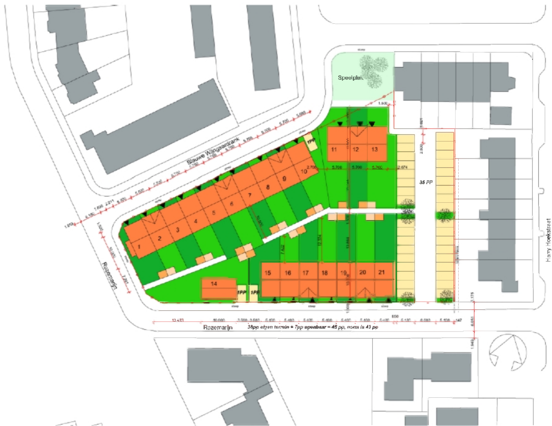
Figuur 6 – Stedenbouwkundige opzet. NB: deze figuur is slechts een indicatie.