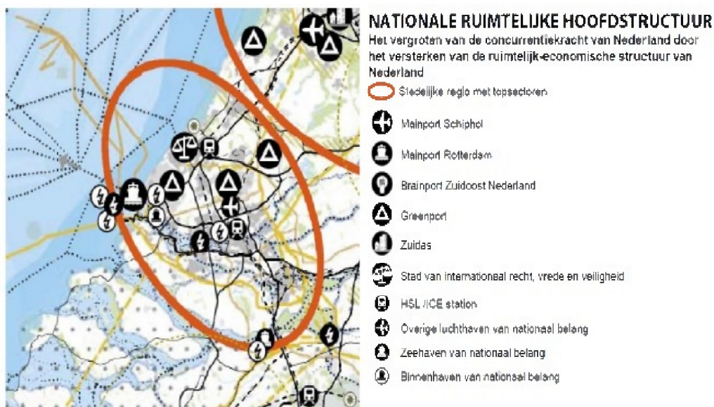
Figuur 5 – Nationale ruimtelijke hoofdstructuur; uitsnede Structuurvisie Infrastructuur en Ruimte

Zo laat het Rijk de verantwoordelijkheid voor de afstemming tussen verstedelijking en groene ruimte op regionale schaal over aan provincies. Daarmee wordt bijvoorbeeld het aantal regimes in het landschaps- en natuurdomein fors ingeperkt. Daarnaast wordt (boven)lokale afstemming en uitvoering van verstedelijking overgelaten aan (samenwerkende) gemeenten binnen provinciale kaders. Afspraken over percentages voor binnenstedelijk bouwen, Rijksbufferzones en doelstellingen voor herstructurering laat het Rijk los. Alleen in de stedelijke regio's rondom de mainports (Amsterdam c.a. en Rotterdam c.a.) zal het Rijk afspraken maken met decentrale overheden over de programmering van de verstedelijking. Vertrouwen in medeoverheden is de basis voor het bepalen van verantwoordelijkheden, regelgeving en Rijksbetrokkenheid. Door hun regionale kennis en onderlinge samenwerkingsverbanden zijn gemeenten en provincies in staat om de opgaven integraal en doeltreffend aan te pakken.