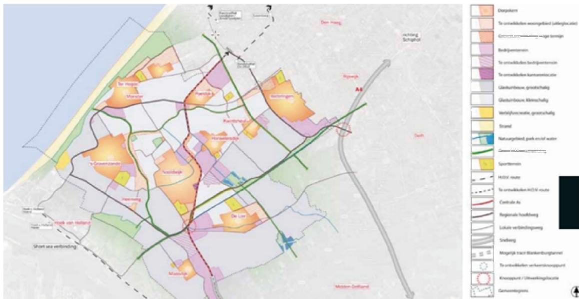
Figuur 2 - Uitsnede leefbaarheidskaart Structuurvisie Westland 2025

De groenblauwe hoofdstructuur van Westland bestaat uit de kust, de Poelzone, de Zwethzone, de Westlandse Zoom, de Gantel en de Blakervaart, die voor mens en dier een reis door Westland aantrekkelijk maken. De stepping stones Staelduinse Bos, Wollebrand, Plas van alle Winden en Prinsenbos vormen de hoofdstructuur, die de kust aan de Hof van Delfland binden.