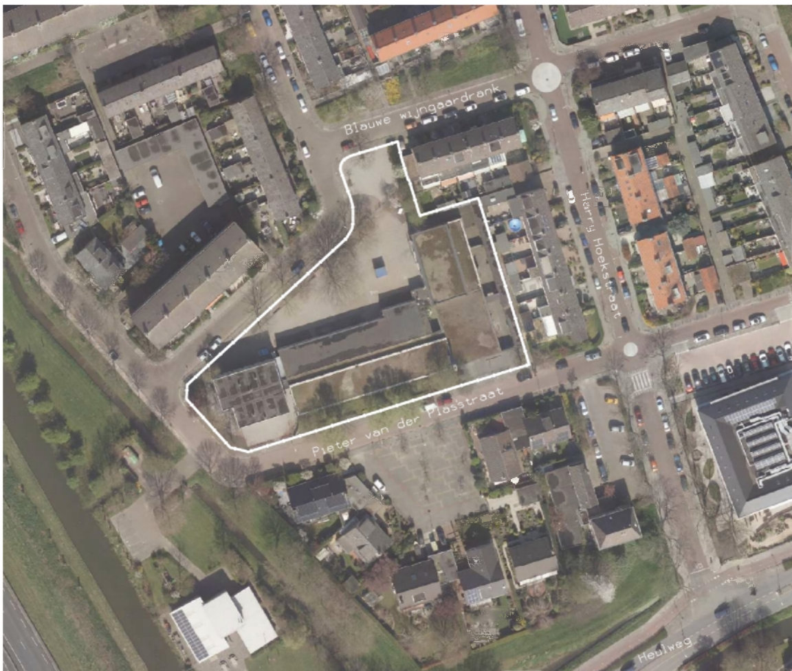
Figuur 1: Afbeelding plangebied

De locatie van de Rozemarijn 1 wordt globaal begrensd door de Rozemarijn, de Blauwe Wijngaardrank en de Harry Hoekstraat. Het oppervlak van het te herontwikkelen terrein bedraagt ca. 3977 m 2 .