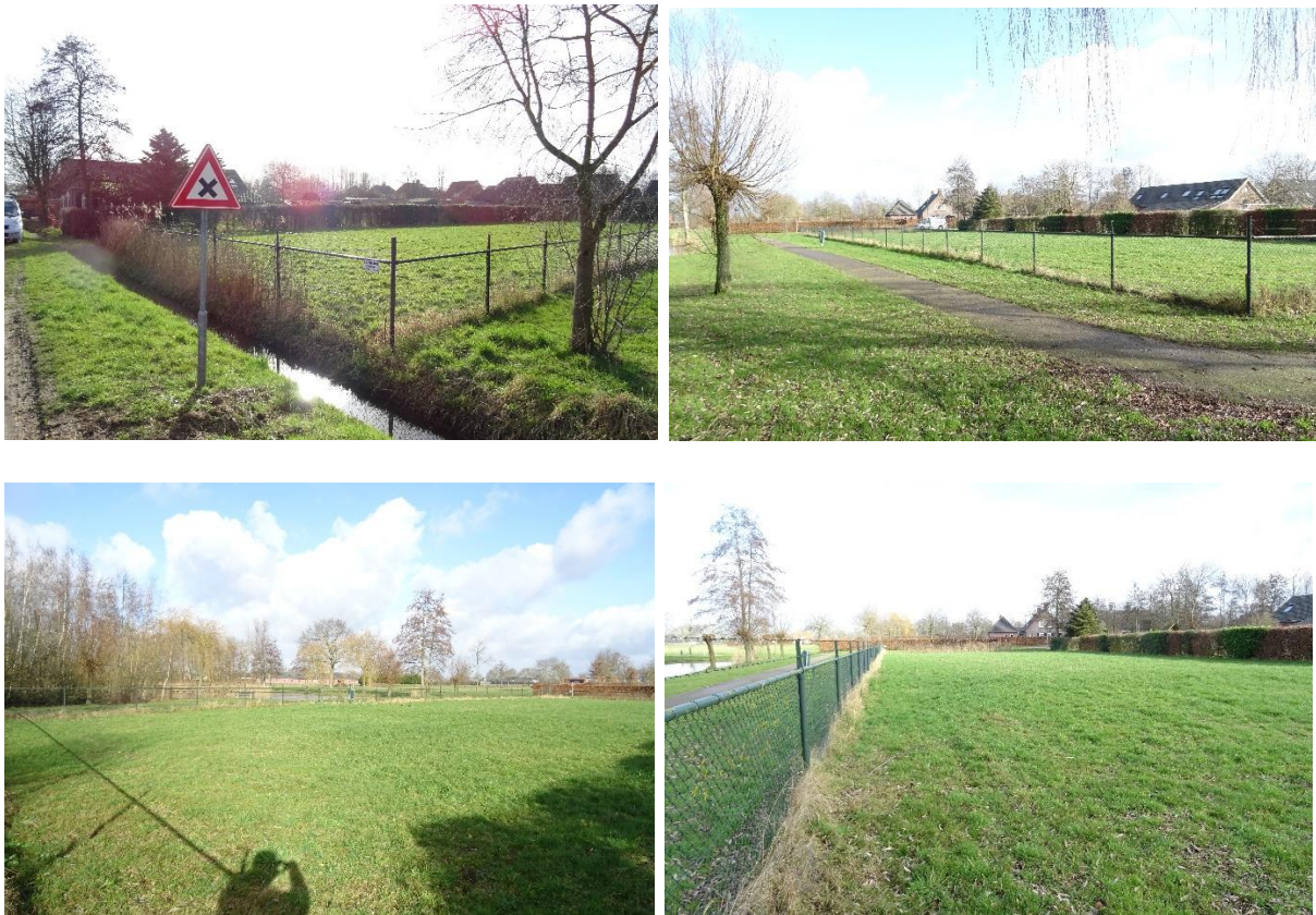
Afbeelding 3 t/m 6: Bestaande te ontwikkelen kavel. Datum: 02-02-2022

Op en nabij de bestaande kavel (zie afbeelding 3 t/m 6) kunnen diverse beschermde plant-, dier- en vogelsoorten voorkomen zoals kleine marters, uilen (in bomen en aangrenzende bebouwingen), vleermuizen (in bomen en aangrenzende bebouwingen) en beschermde vaatplanten.