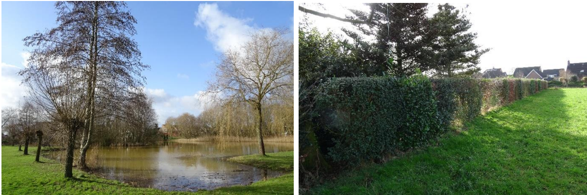
Afbeelding 7 en 8: waterpartij/ vijver ten zuidwesten van de kavel en bestaande beplantingen op de kavelgrens. Datum: 02-02-2022

Dit zal afhankelijk zijn van de soorten die voor komen, en op welke wijze zij het gebied gebruiken (groeiplaats, voortplantingsplaats, verblijfplaats of foerageerplaats). Elke functie kent een ander beschermingsregime.