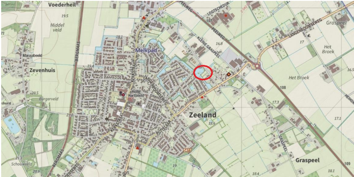
Afbeelding 1: Globale ligging van het plangebied. De locatie, Kleine Graspeel ong., ten oosten van de kern van Zeeland, waar de quickscan uitgevoerd is, wordt globaal aangeduid met de rode cirkel.

Het plangebied is gelegen ten oosten van de kern Zeeland (zie afbeelding 1). De bestaande kavel is momenteel in gebruik als grasland, met aan de noordzijde een gemengde haag en ten zuidwesten van de kavel is waterpartij aanwezig.