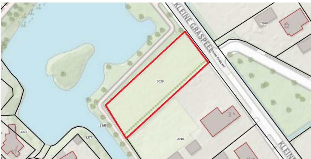
Afbeelding 2: De kavel met kavelnummer: 3039, welke bezocht en onderzocht is op de aanwezigheid van beschermde soorten flora en fauna.

Tijdens het veldbezoek is een quickscan uitgevoerd op de projectlocatie en is gezocht naar de aanwezigheid van beschermde flora en fauna en de daarbij behorende vaste rust- en verblijfplaatsen.