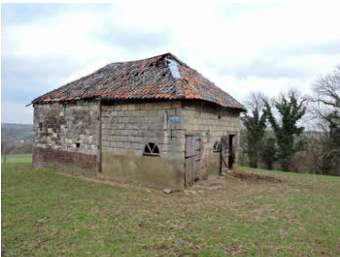
3. De rechter zijgevel. De stalraampjes in beton dateren van rond 1960