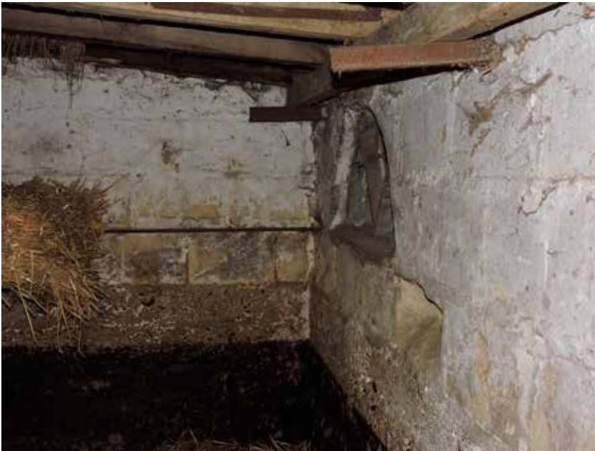
16. Ook hier een combinatie van beton en mergel