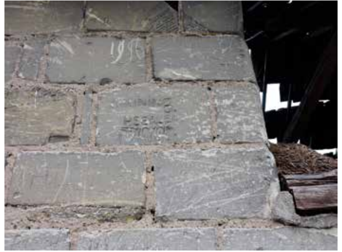
10. Het slordige mergelwerk met enkele inscripties