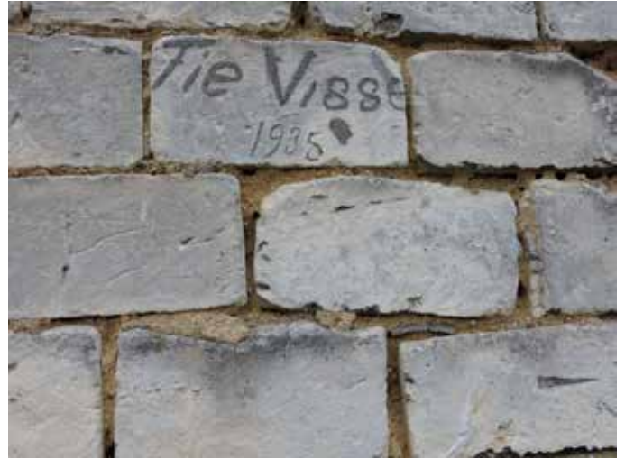
14. Een duidelijk voorbeeld van een hergebruikte steen: de familienaam liep oorspronkelijk door op de naastgelegen steen