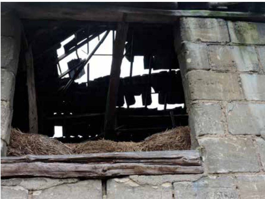
17. Het zwakke centrale spant in de schuur