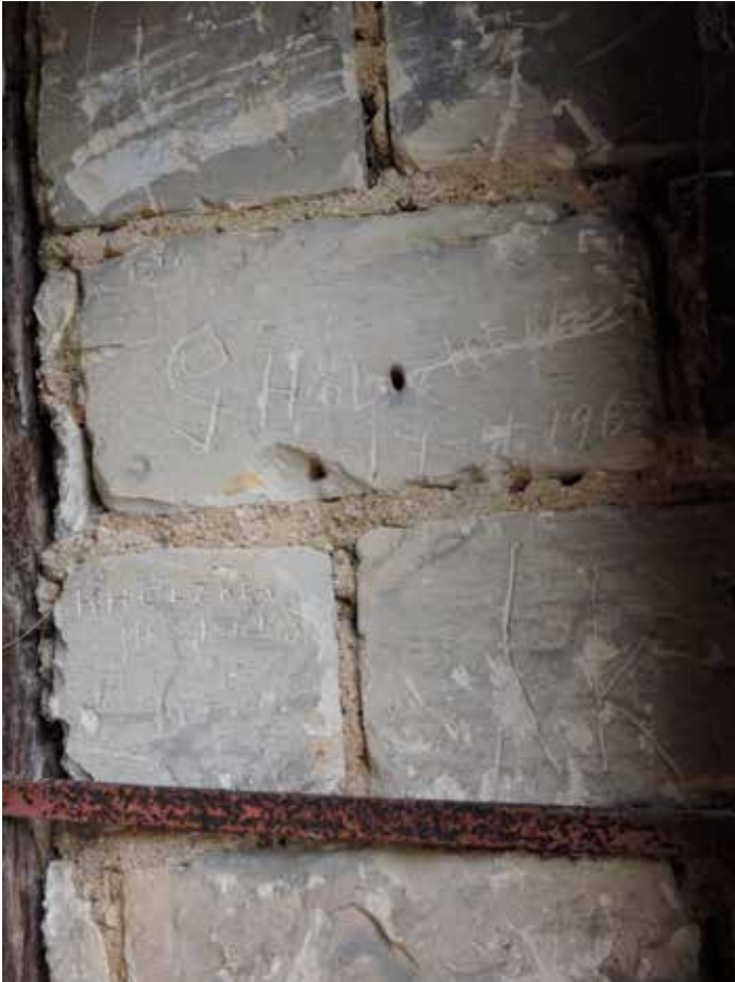
13. Twee stenen met de inscriptie van dezelfde familienaam, een uit 1937, de andere uit 1963