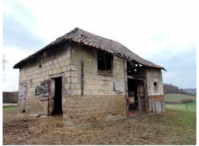
6. Zij- en achtergevel. De sokkel van het linker deel bestaat uit zelfgemaakte betonblokken. De hoge opening is een hooiluik, de poortopening is voorzien van een primitief kozijn. Het ontbreken van een poort biedt de mogelijkheid voor vee om te schuilen