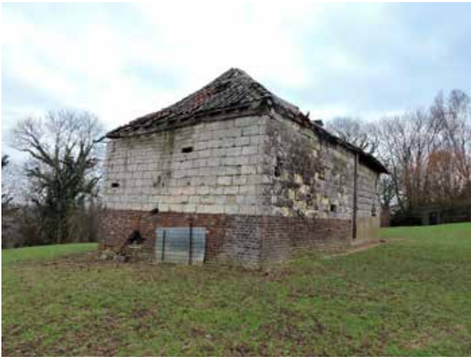
1. Het schuurtje aan de noordkant: de bakstenen sokkel en de muur in mergel stammen uit dezelfde bouwfase. Het hergebruik van materiaal wordt geïllustreerd door de kleine blokjes mergel, linksboven. Linksonder zit een reparatie met zelfgemaakte betonstenen