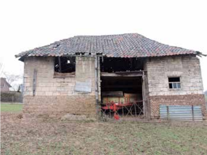
7. De achtergevel in zijn geheel