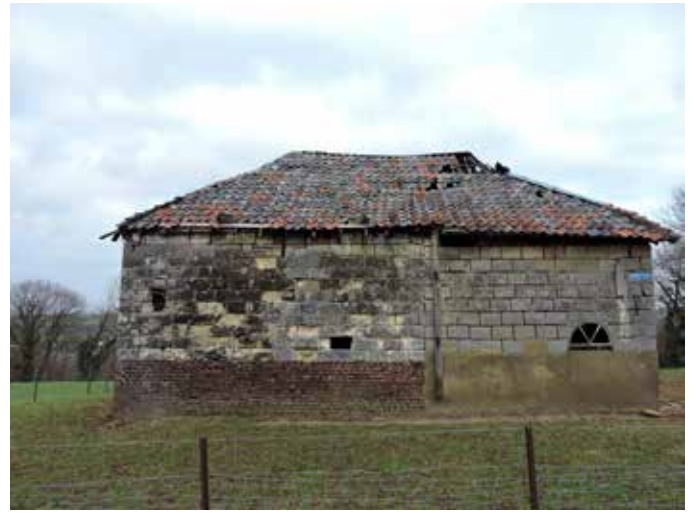
2. De gevel aan de straatzijde: links is het oudste en dus meest verweerde deel. De verticale balk tegen de muur stabiliseert een ondermaats spant aan de binnenzijde. Voor alle mergel geldt dat die door niet-deskundigen is verwerkt, immers, een mergelwerker zorgt voor minimale voegen om verweer tegen te gaan. Bij het hergebruik dat hier heeft plaatsgevonden, en waarbij blokken van ongelijk formaat zijn gebruikt, was daar geen aandacht voor. Vandaar de dikke voegen met een grove specie. Het schilddak is gedekt met Vlaamse pannen in verschillende kleurschakeringen. Links is de oplopende dakaansluiting afgedekt met nokpannen van het type mulden, rechts deels met een strook zink