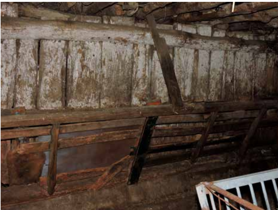
15. De stal rechts in de zijgevel