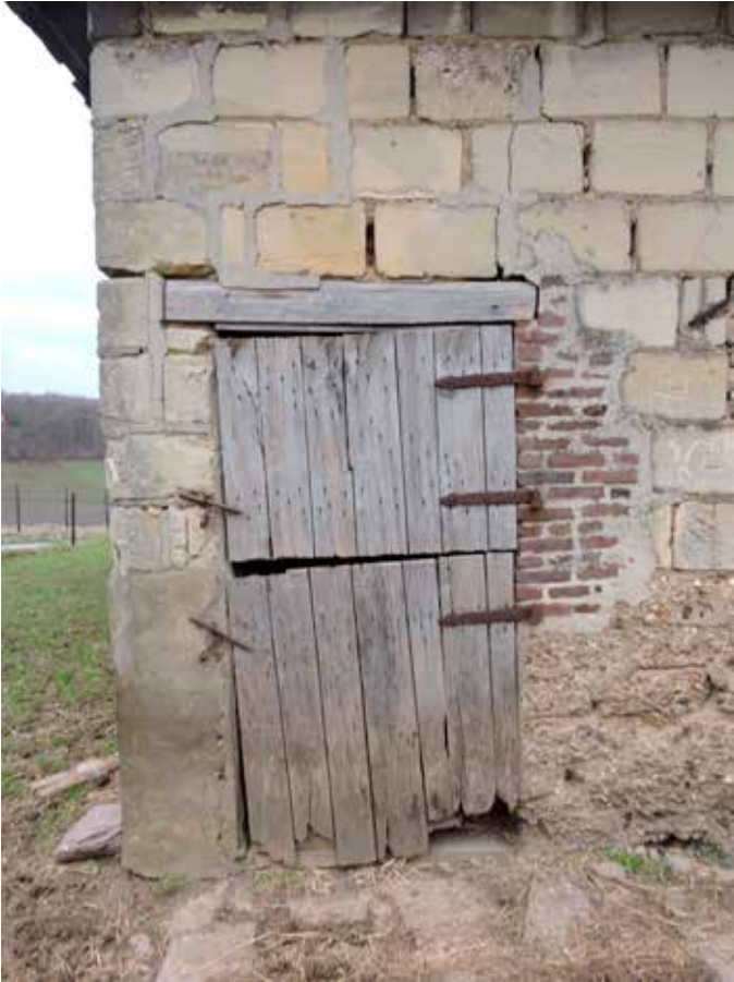
5. Een staldeurtje links