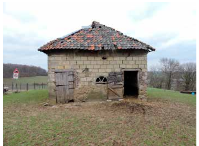
4. De rechter zijgevel met zijn schilderachtige rommeligheid die voortkomt uit de diverse gebruikte materialen