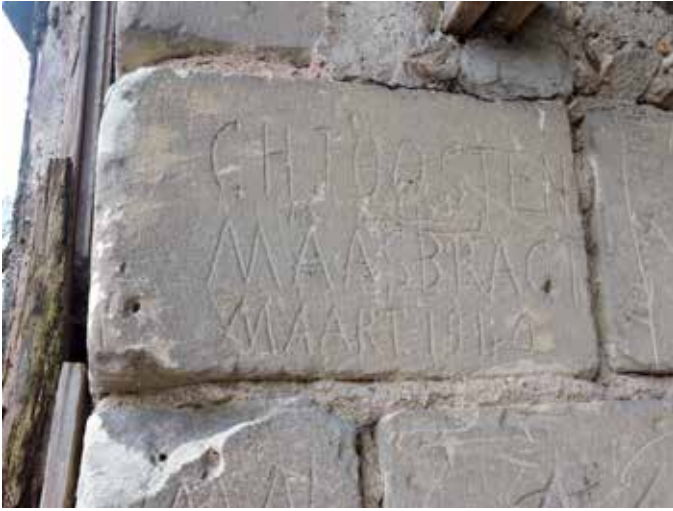
9. Een hergebruikte steen uit 1840. De spelling van de plaatsnaam Maasbracht met een G in plaats van CH komt overeen met het jaartal