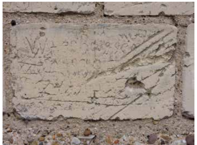
12. Een meermaals bekraste steen