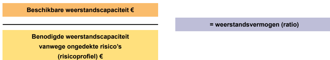
Figuur 1: Berekening ratio weerstandsvermogen

De benodigde weerstandscapaciteit is € 2.110.000 en de beschikbare weerstandscapaciteit is € 2.000.000. Het weerstandsvermogen komt dan uit op 0,95. Volgens de kwalificatie van het Nederlands Adviesbureau is de omvang van het weerstandsvermogen in relatie tot geïdentificeerde risico's daarmee matig (boven de 1 is voldoende).