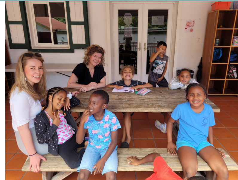
Medewerkers Kinderombudsman tijdens een werkbezoek aan Saba en Sint Eustatius. In 2022 zijn er verschillende, gezamenlijke werkbezoeken vanuit de Nationale ombudsman en Kinderombudsman in Caribisch Nederland georganiseerd.

Tot slot is er een onderzoek gedaan naar vreemdelingen zonder verblijfsvergunning op Bonaire. In het algemeen blijkt uit de deelname aan de spreekuren en het aantal klachten dat binnenkomt, dat burgers in Caribisch Nederland de ombudsmannen steeds beter weet te vinden. Er werden vanuit de ombudsman vier bezoeken gebracht aan de eilanden.