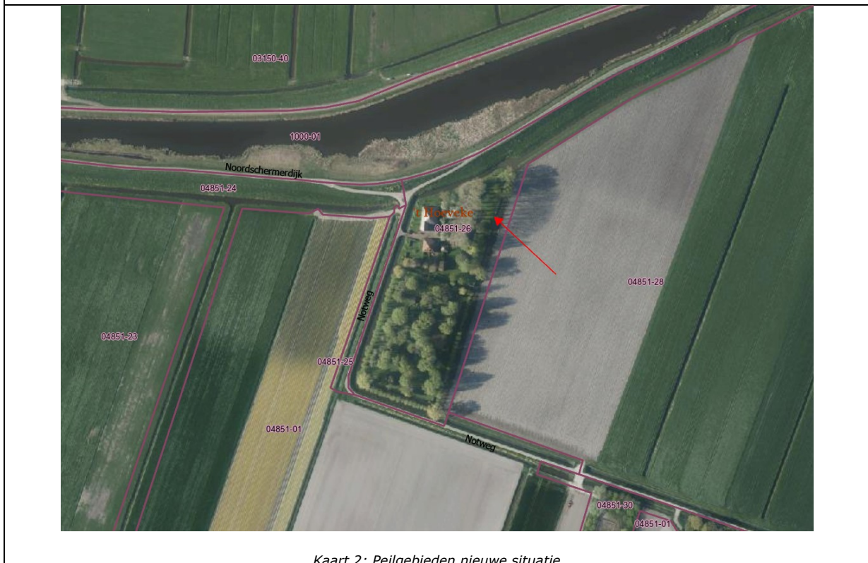
Kaart 2: Peilgebieden nieuwe situatie