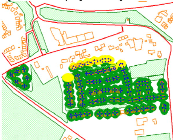
Figuur 2: Overschrijding voorkeursgrenswaarde vanwege het verkeer op de Rondweg Volkel/N264

Uit de resultaten van het geluidonderzoek blijkt dat de voorkeursgrenswaarde van 48 dB wordt overschreden ter hoogte van nagenoeg alle woningen binnen de planlocatie vanwege het verkeer Rondweg Volkel/N264. De hoogste geluidbelastingen treden op aan de noordzijde van de planlocatie (geel omcirkeld in figuur 2). De berekende geluidbelastingen zijn ter hoogte van de gele locatie ten hoogste 55 dB. Op alle overige woningen (groen omcirkeld in figuur 2) is een geluidbelasting berekend van ten hoogste 52 dB.