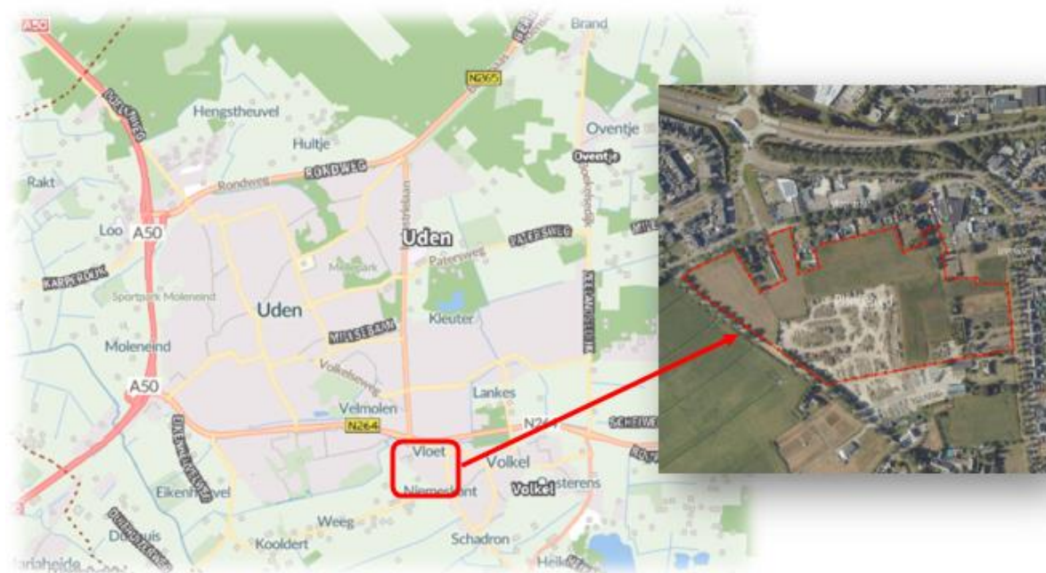
Figuur 1: Ligging planlocatie (rood omkaderd)

In de navolgende figuur is de ligging van de planlocatie weergegeven.