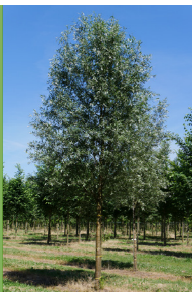
Salix alba - Schietwilg