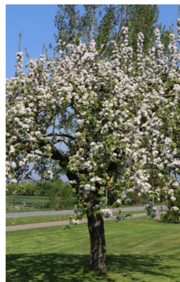
Malus domestica - Appelboom