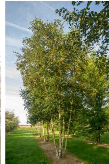
Betula pendula - Ruwe berk