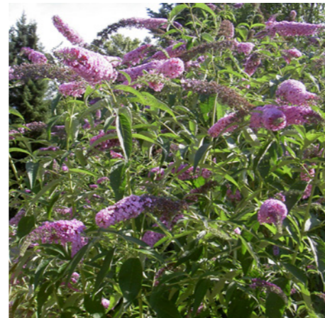
Buddleja davidii - Vlinderstruik