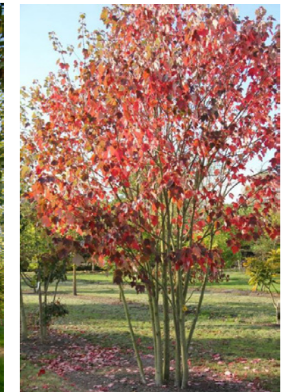
Acer rubrum - Rode esdoorn