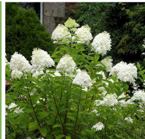
Hydrangea paniculata 'Grandiflora' - Pluimhortensia