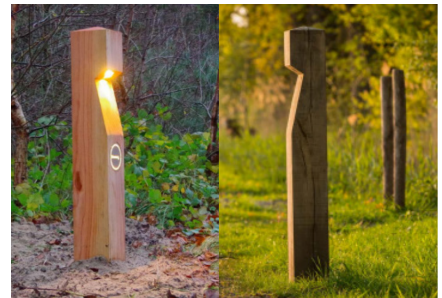
EYE, 0,9 meter hoog leverancier: Van Hees infra products (of gelijkwaardig)