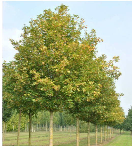
Acer campestre - Veldesdoorn