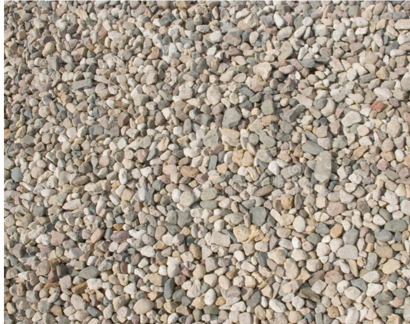
grint, gele tint