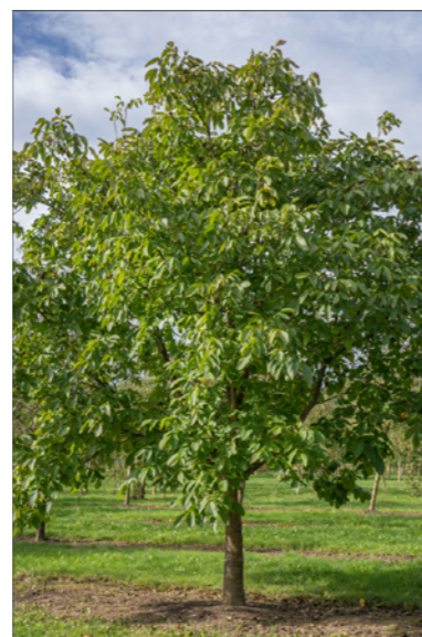
Juglans regia - walnoot