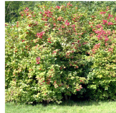
Viburnum opulus - Gelderse roos