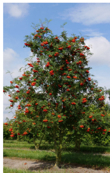
Sorbus aucuparia - Gewone lijsterbes