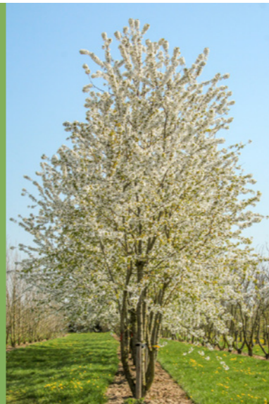
Prunus avium - Zoete kers