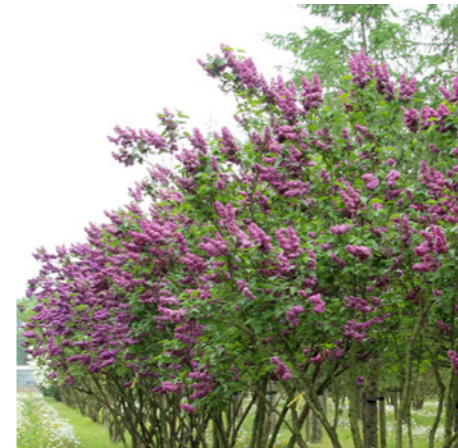
Syringa vulgaris - sering