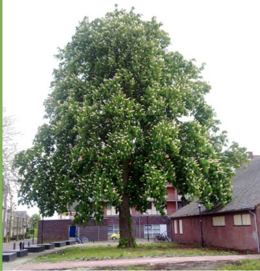
Aesculus hippocastanum 'Baumannii' - Paardenkastanje