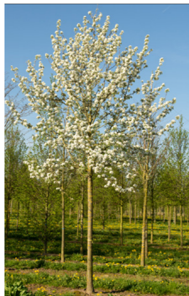
Pyrus communis - Peer