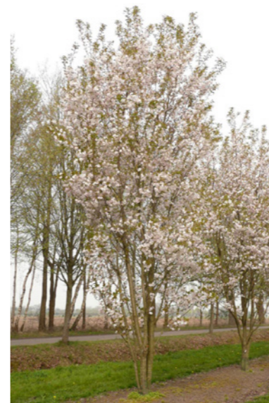
Prunus serrulata 'Sunset Boulevard' - Sierkers