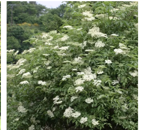
Sambucus nigra - Vlierbes