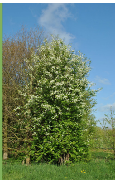
Prunus padus - Gewone vogelkers