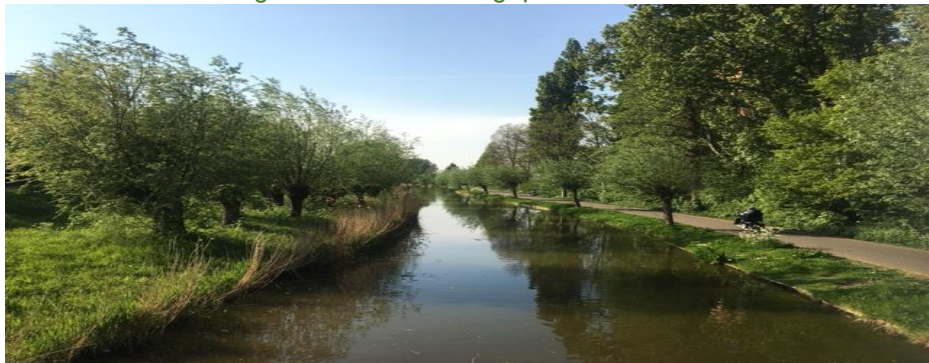
De schoonheid van het Nieuwe Water