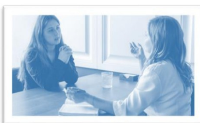
Stress sensitieve hulp