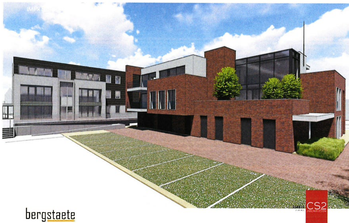
Afbeelding 1: concept straatbeeld vanaf de Bergstraat