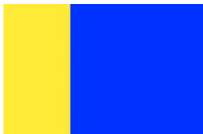
Vlag van voormalige gemeente Uden

In een tweetal bijeenkomsten zijn diverse ontwerpen besproken. De ontwerpen zijn vervaardigd door de vertegenwoordiger van de NBCWV, waarbij de richtlijnen in acht zijn genomen (zie hieronder). Als basis voor deze ontwerpen dienden het wapen van Maashorst en de vlaggen van de voormalige gemeenten Uden, Landerd, Zeeland, Schaijk en Reek. De voormalige vlag van Zeeland is niet meegenomen in de ontwerpen, omdat deze qua styling niet in te passen is.