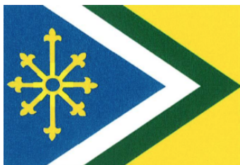
Voorkeursontwerp Hoge Raad van Adel (staken van de karbonkel zitten vast)

De voorkeur van de Hoge Raad van Adel gaat uit naar ontwerp 1. Wel wordt er een kanttekening geplaatst over de vorm van de karbonkel in ontwerp 1. In het advies wordt aangegeven dat het los plaatsen van de staken aan de ring niet nodig is. Vanaf een afstand is het los plaatsen van de staken van de karbonkel niet goed zichtbaar en daarbij is het een ongebruikelijke voorstelling van een dergelijk oud wapenfiguur.