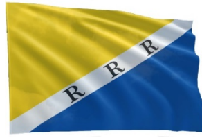
Vlag van de voormalige gemeente Reek