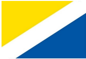
Vlag van voormalige gemeente Schaijk