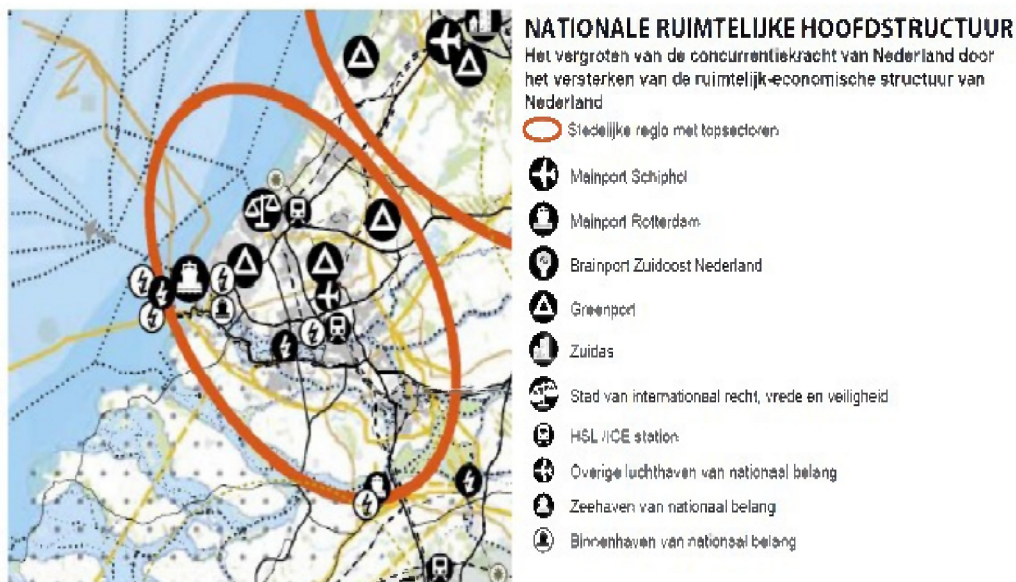
Figuur - Uitsnede kaart nationale ruimtelijke hoofdstructuur

Het Westland is op de kaart van de nationale ruimtelijke hoofdstructuur aangewezen als Greenport.