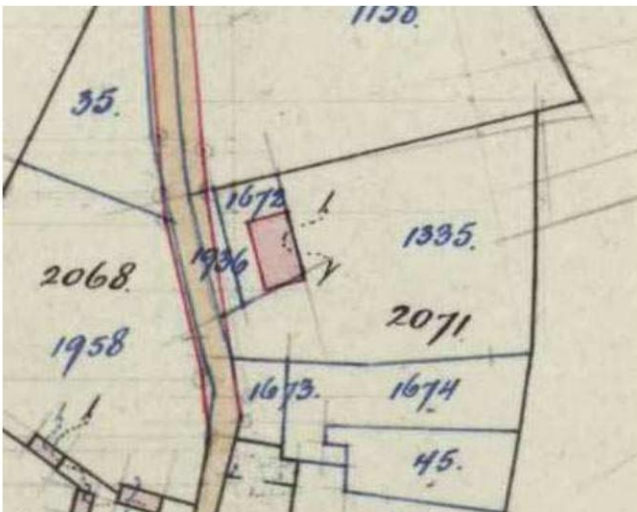
3 Nieuwbouw van de schuur, weergegeven op de hulpkaart uit 1940. De woonbebouwing was in 1895 afgebrand. (Kadaster, Archiefviewer)