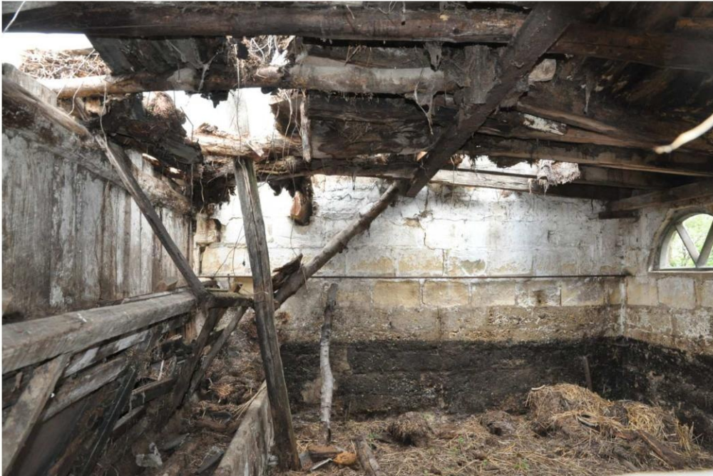
8 De zuidoostelijke stalruimte met ingestorte balklaag. (foto Buro4 26 juli 2022)