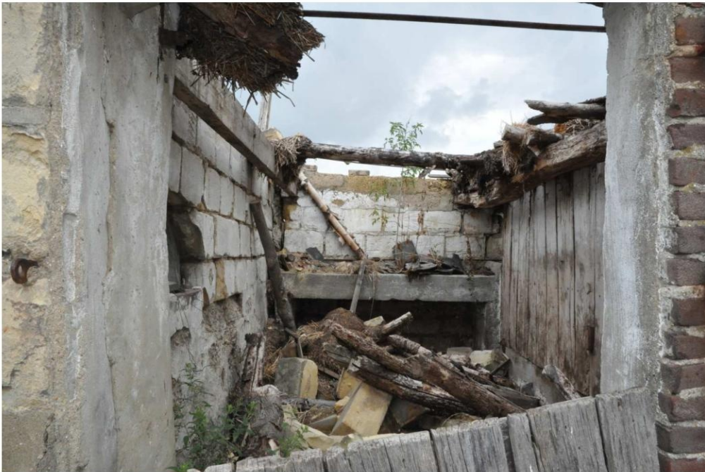
7 De zuidwestelijke stalruimte van de schuur, met voedertrog. (26 juli 2022)