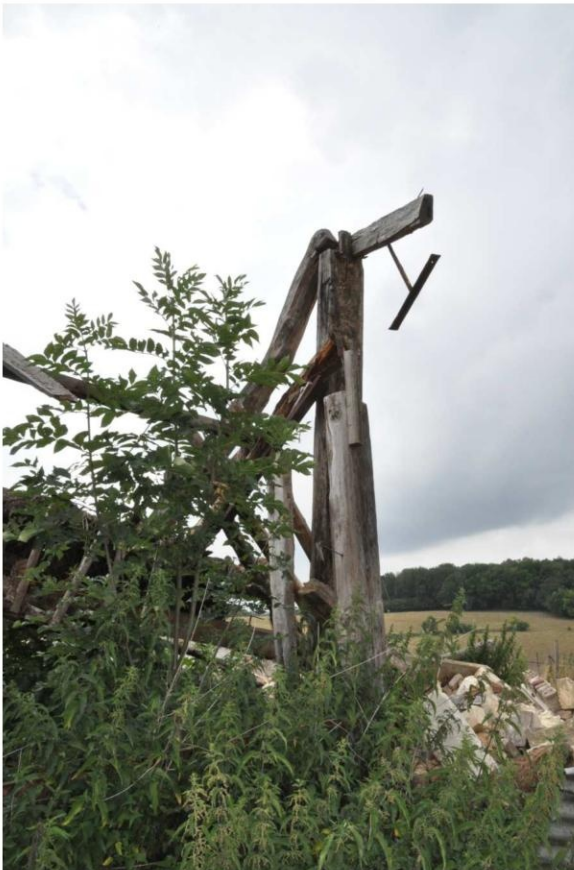
11 Het gebint van het noordelijke schuurdeel is grotendeels ingestort. (foto Buro4 26 juli 2022)