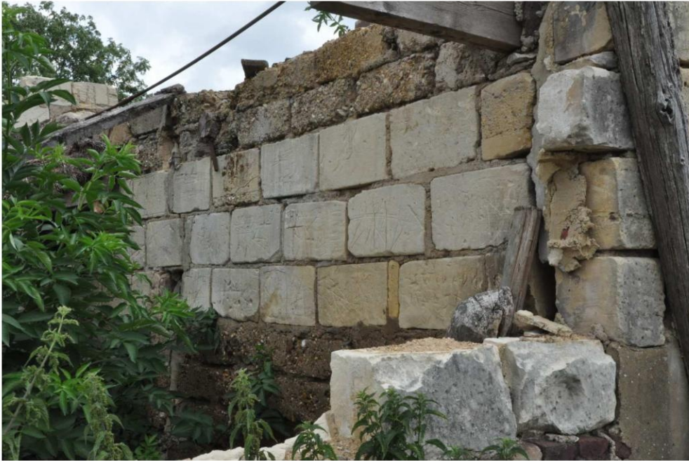
10 De stenen scheidingsmuur tussen het noordelijke en zuidelijke deel van de schuur / stal. (foto Buro4 26 juli 2022)