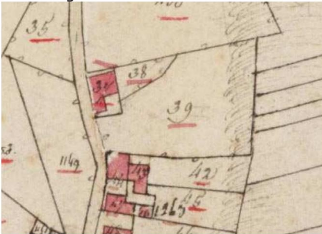
1 Uitsnede uit de kadastrale minuutkaart van 1829 met de woonbebouwing die voorafging aan de schuur.