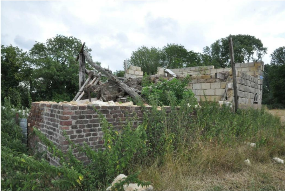
6 De schuur gezien vanuit het noordwesten. (foto Buro4 26 juli 2022)