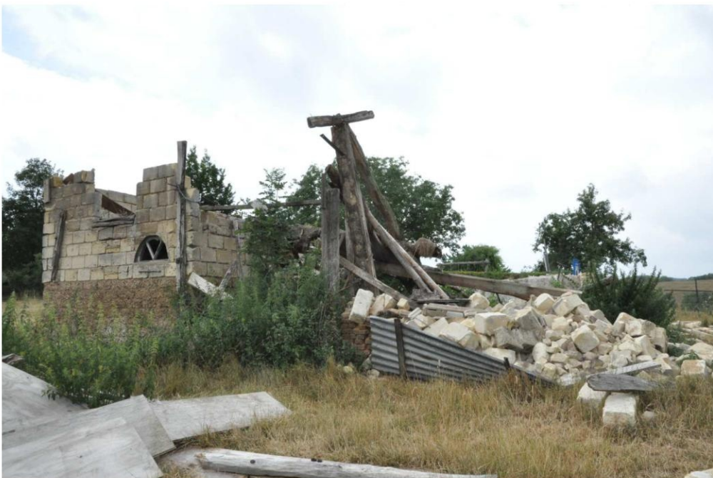
5 De schuur gezien vanuit het oosten. (foto Buro4 26 juli 2022)