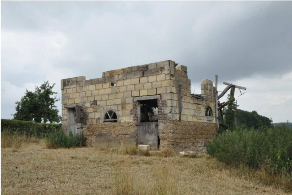
4 De schuur, gezien vanuit het zuidoosten. (foto Buro4 26 juli 2022)