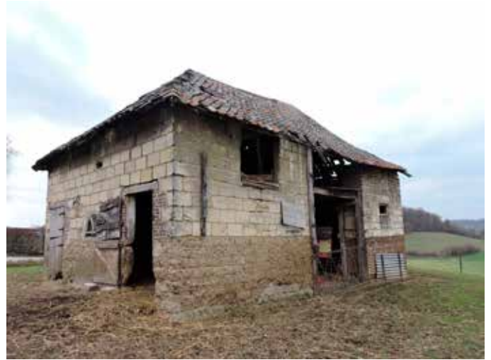
6. Zij- en achtergevel. De sokkel van het linker deel bestaat uit zelfgemaakte betonblokken. De hoge opening is een hooiluik, de poortopening is voorzien van een primitief kozijn. Het ontbreken van een poort biedt de mogelijkheid voor vee om te schuilen