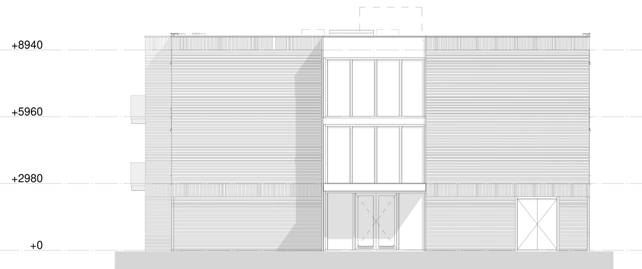
RECHTER ZIJAANZICHT - AS 5