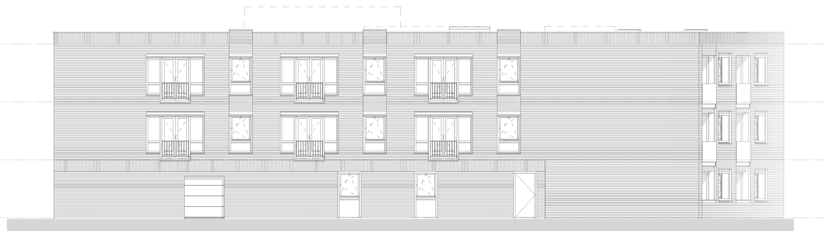
ACHTERAANZICHT - AS E