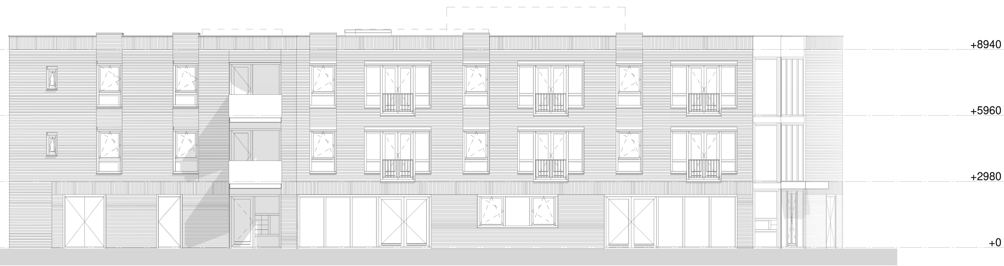
VOORAANZICHT - AS A