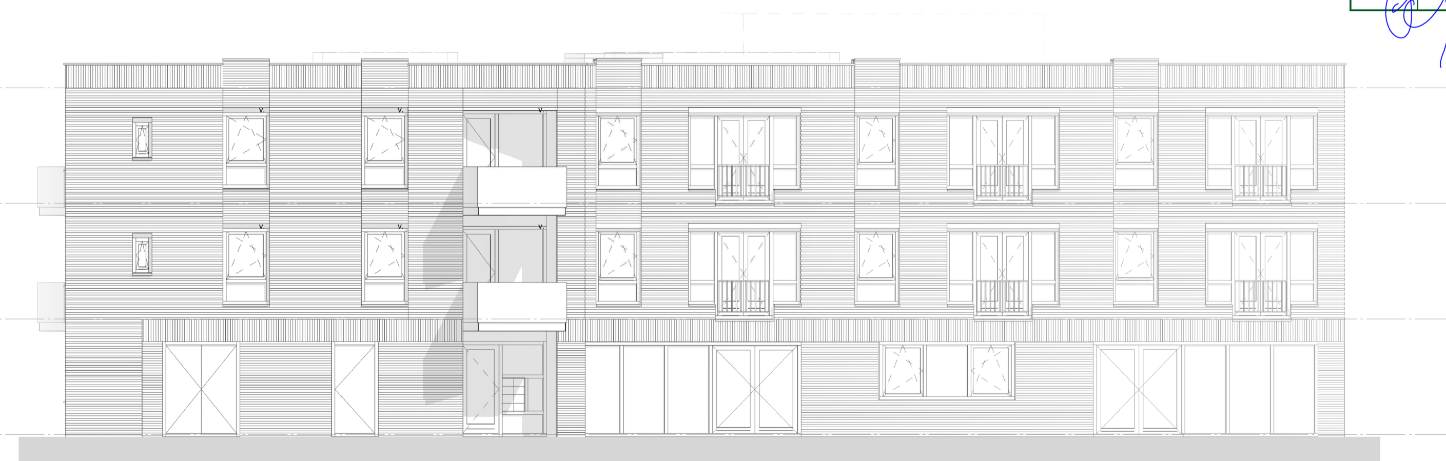
VOORAANZICHT - AS X1