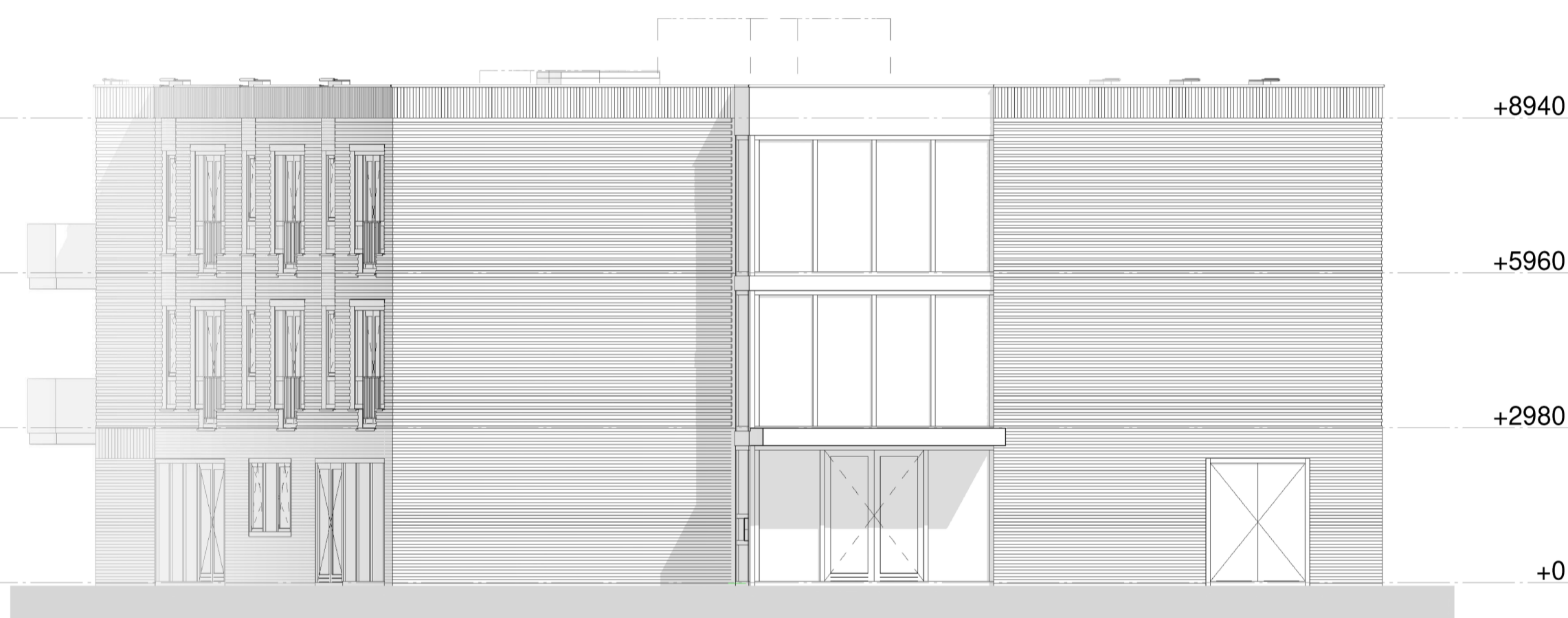
RECHTER ZIJAANZICHT - AS Y2