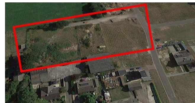
Figuur 1: Planlocatie (ondernemers)woningen Reek-Zuid