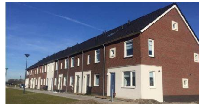
Figuur 2: Bestaande woningen Reek-Zuid