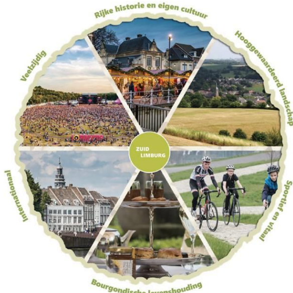
Fig. 1: Kernkwaliteiten bestemming Zuid Limburg

Wat Zuid-Limburg als toeristisch-recreatieve bestemming uniek maakt, is de nabijheid van zowel stedelijke als landschappelijke topkwaliteiten in een internationale context. De recreant en toerist in Zuid-Limburg heeft zowel de geneugten van de stad als het land steeds binnen handbereik, en beide zijn in de basis van topkwaliteit. Het gaat om het unieke en hooggewaardeerde heuvellandschap en het erfgoed, samen met de vele voorzieningen, steden, attracties en dingen om te doen.