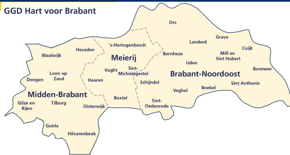
GGD Hart voor Brabant