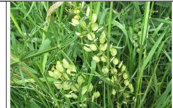
12/05, witte krodde , Delfgauw, Jos van Koppen.