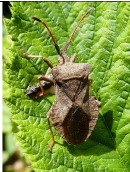
15/05, zuringrandwants op framboosblad met vogelpoep , Den Hoorn, Willemein Poot.