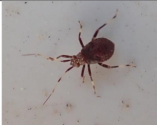
21/04, Essenprachtblindwants nimf , Wezeltuin, Marian