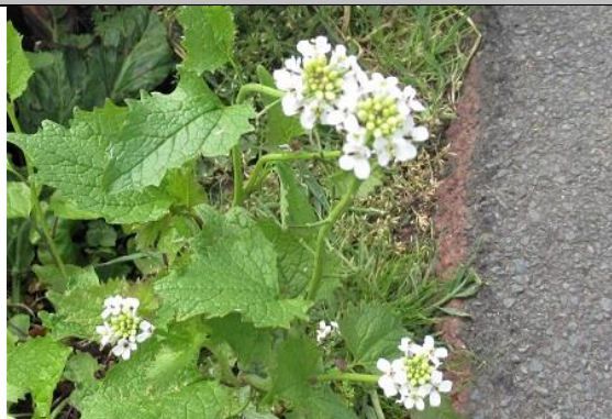
12/05, look zonder look , Delfgauw, Jos van Koppen.

Op het kroontjeskruid dat ik al eerder zag heb ik nu ook de larve van een lieveheersbeestje gesignaleerd en verder ook nog bloeiende herik . De reukeloze kamille bloeit nu ook. En de bloempjes van de kleine varkenskers staan nu ook op de foto. Raket bloeit ook in dit blok, bij het tankstation.