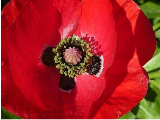
12/05, klaproos , Den Hoorn, Willemein Poot.