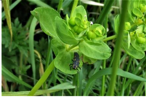
12/05, kroontjeskruid , met larve lieveheersbeestje , Delfgauw, Jos van Koppen.