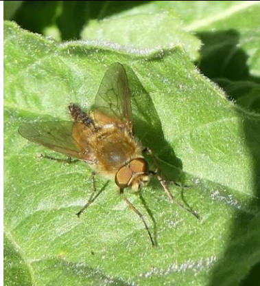
15/05, viltvlieg , Den Hoorn, Willemein Poot.