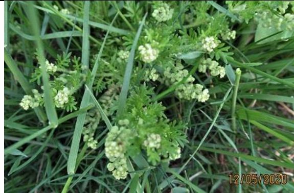
12/05, kleine varkenskers , Delfgauw, Jos van Koppen.