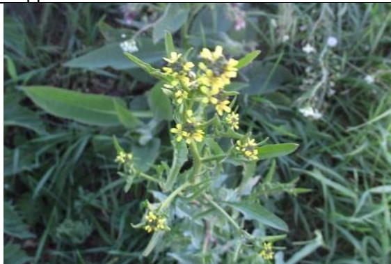
05/05, raket , Delfgauw, Jos van Koppen.