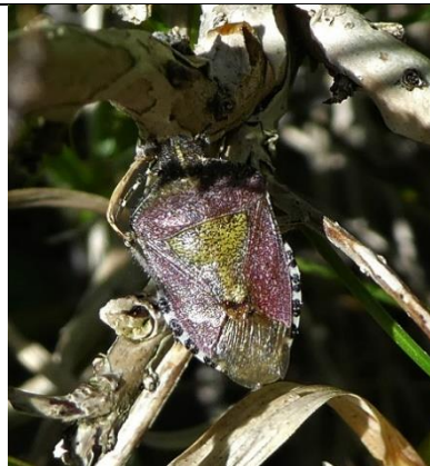
15/05, bessenschildwants , Den Hoorn, Willemein Poot.