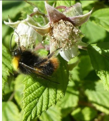
15/05, weidehommel op framboosbloem , Den Hoorn, Willemein Poot.