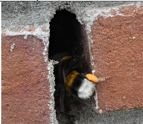
14/05, aardhommel bij het nest, Den Hoorn, Willemein Poot.