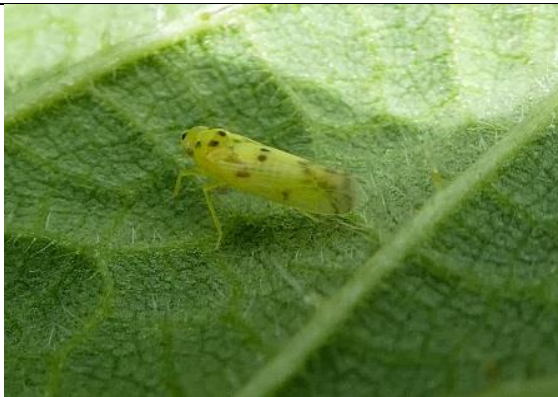
15/05, Balclutha punctata , op blad van grote brandnetel, Den Hoorn, Willemein Poot.