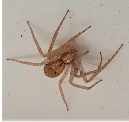
12/05, zwartrugenspin , Wezeltuin, Marian