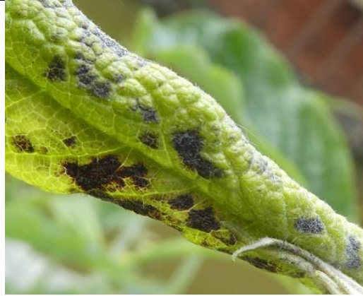
15/05, schimmel? op mijn vlinderstruik, Den Hoorn, Willemein Poot.