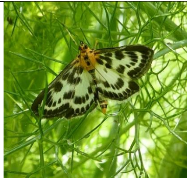
15/10, bonte brandnetelmot op wilde venkel , Den Hoorn, Willemein Poot.