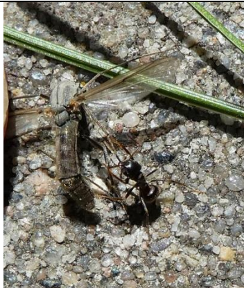
15/05, wegmier vangt dansmug , Den Hoorn, Willemein Poot.