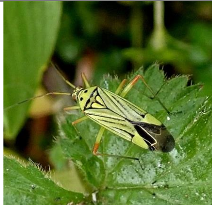
16/05, Essenprachtblindwants imago , Wezeltuin, Marian