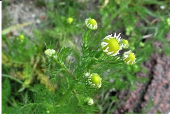
12/05, reukeloze kamille , Delfgauw, Jos van Koppen.