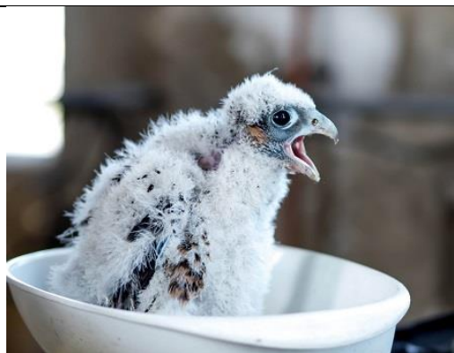
15/05, jonge slechtvalk , toren Bouwkunde