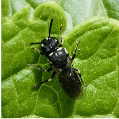
15/05, maskerbij , Den Hoorn, Willemein Poot.