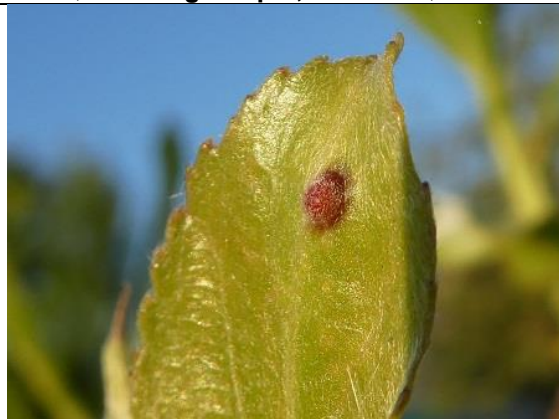
14/05, galmug? op knotwilgenblad, 't Woud, Willemein Poot.