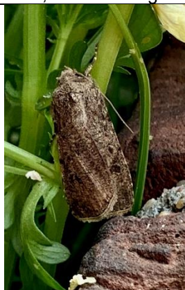
10/05, gewone velduil , Delft, Marleen Hogeweg.