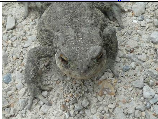
10/05, gewone pad , Schipluiden, Willemeijn Poot.