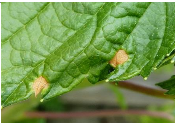
15/05, gemineerd zwarte besenblad , Den Hoorn, Willemein Poot.