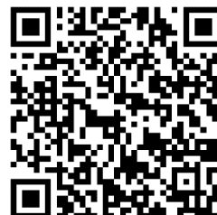
Monitor Brede Welvaart