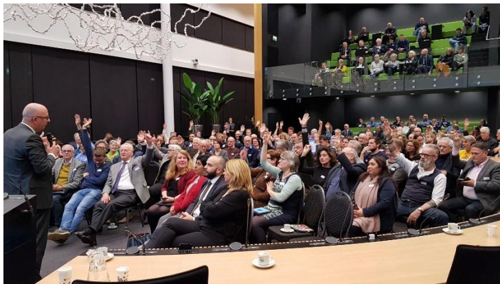
Tijdens de Verenigde Voorbereidende Vergadering voor Gemeenteraden en Waterschapsbesturen werden 13 wijzigingsvoorstellen besproken en gepeild (klik hier )

Wát we doen, hebben we vastgelegd in de Samenwerkingsagenda 'Richting 2030'. Hoe we het doen, leggen we vast in een Samenwerkingsconvenant en Samenwerkingsafspraken. In onze samenwerking hebben we onze eigen spelregels bepaald. Zowel dit convenant als de afspraken lopen mee in de besluitvorming over de Samenwerkingsagenda.