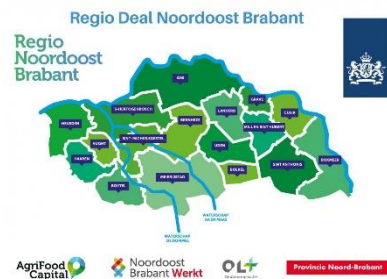
Partners Regio Deal