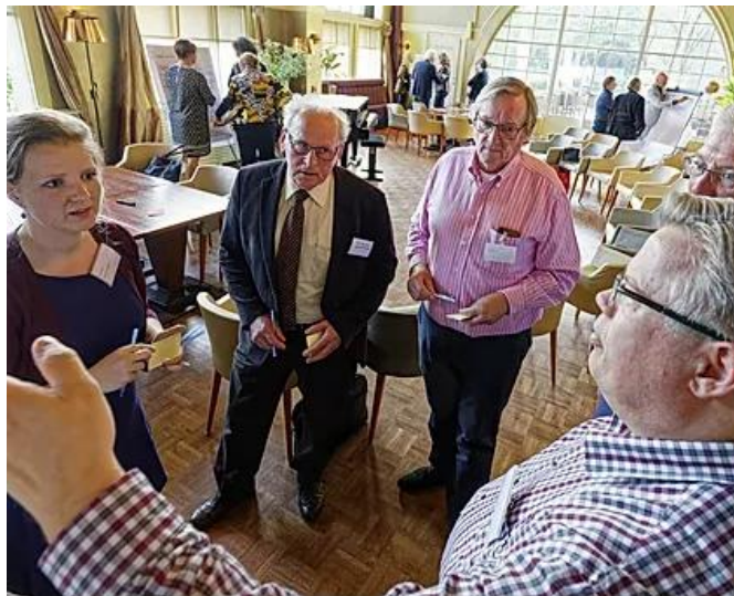
Tijdens de 'regioreis' zijn de nieuwe opgaven voor de nieuwe Samenwerkingsagenda opgehaald (klik hier ).

De slagkracht wordt voornamelijk bepaald door de ambtelijke capaciteit die door de deelnemende gemeenten en waterschappen zelf ter beschikking wordt gesteld. De uitvoering van het nieuwe Samenwerkingsconvenant en de Samenwerkingsafspraken vindt plaats op basis van de 'coalitie van de bereidwilligen'. Diegene die wil meedoen, stelt capaciteit en/of middelen beschikbaar.