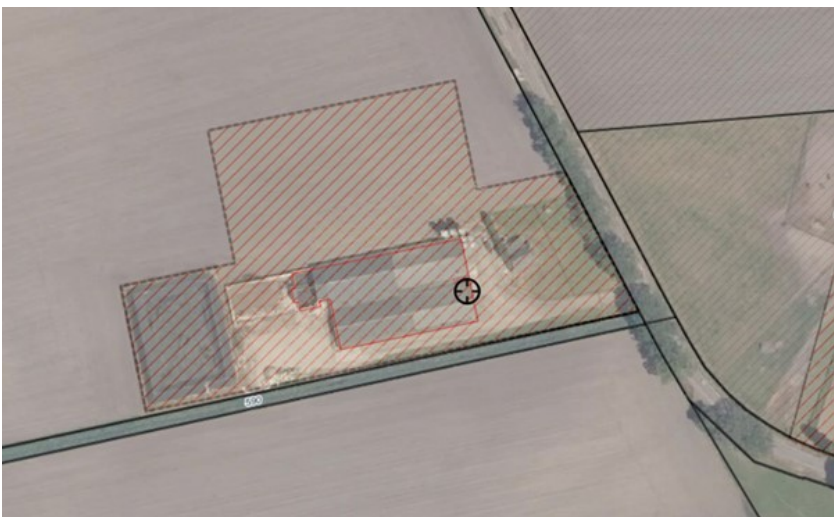
Figuur: Huidige situatie locatie Elzen 6A te Boekel