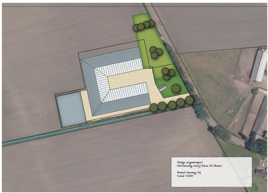
Figuur: Schetsontwerp vergunde situatie Elzen 10A, Boekel

negatieve effecten op het Buurtschap indien de vergunning die 2016 verleend is door gemeente Boekel gericht op ontwikkeling van deze locatie, ook daadwerkelijk uitgevoerd wordt. Zij vrezen voor verdere geuroverlast en een toename van zwaar agrarisch verkeer. Buurtbewoners geven aan dat zij in onzekerheid verkeren over welke ontwikkelingen er nog allemaal mogelijk zijn op locatie Elzen 10A. Ook zijn zij bezorgd over de aanvoer van mest, het roeren van de mest en de verwerking van mest op deze locatie. Een stevige opgave om te komen tot een verbetering van de situatie en de sociale verhoudingen omdat gemeente Boekel in deze casus wat 'achter de feiten aanloopt.'