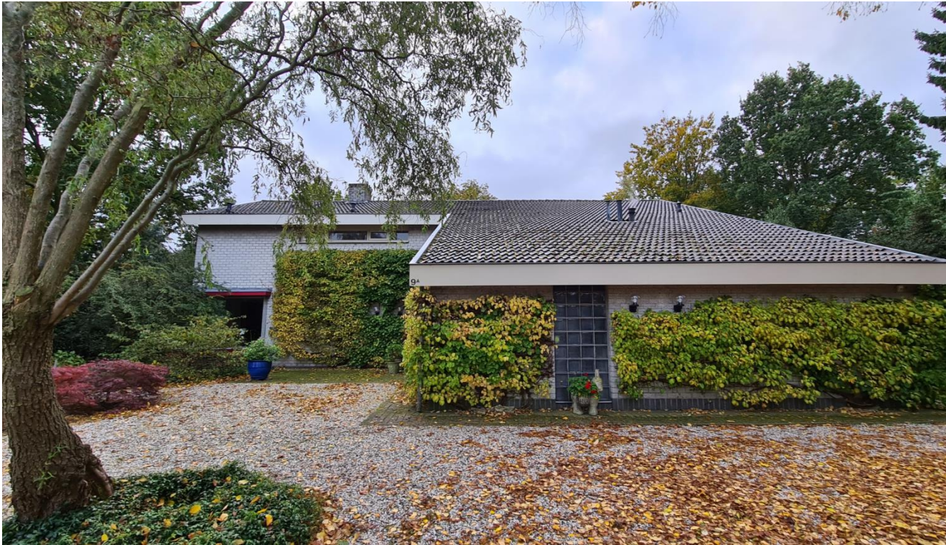
Figuur 4: Woning gezien vanuit het noorden