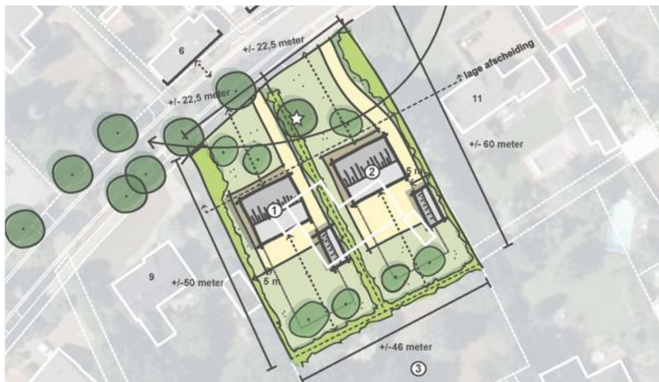
Figuur 3: Toekomstige situatie plangebied