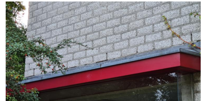
Figuur 6: Drie open stootvoegen boven venster