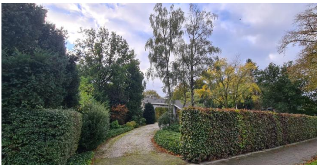
Figuur 7: Plangebied gezien vanaf de Maasstraat