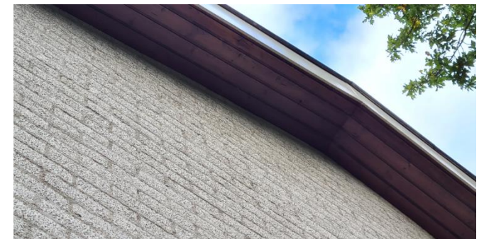
Figuur 9: Detailopname dakrand