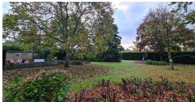
Figuur 8: Tuin en overkapping