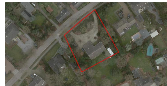
Figuur 2: Luchtfoto plangebied en directe omgeving