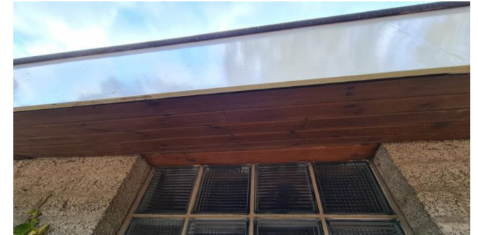
Figuur 5: Detailopname dakrand