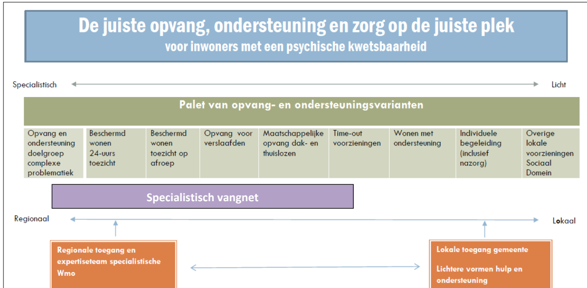
Figuur 3: Wmo-voorzieningen voor psychisch kwetsbare inwoners

op orde), wordt onnodig gebruik gemaakt van het ander (regionaal vangnet). Daarom richt de uitvoering van de Ontwikkelagenda zich op zowel de lokale- als regionale inspanningen die nodig zijn om de doelstellingen te bereiken, samen te leren en de samenwerking te versterken.