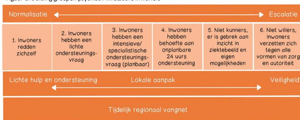
Figuur 1: Duiding groepen psychisch kwetsbare inwoners

Het is op basis van beschikbare data niet mogelijk om concrete aantallen te plaatsen bij de categorieën, omdat deze omschrijving nieuw is en omdat situaties/ondersteuningsbehoeften van inwoners wisselen per moment. Wat we wel weten is het regionale bereik het specialistisch vangnet: