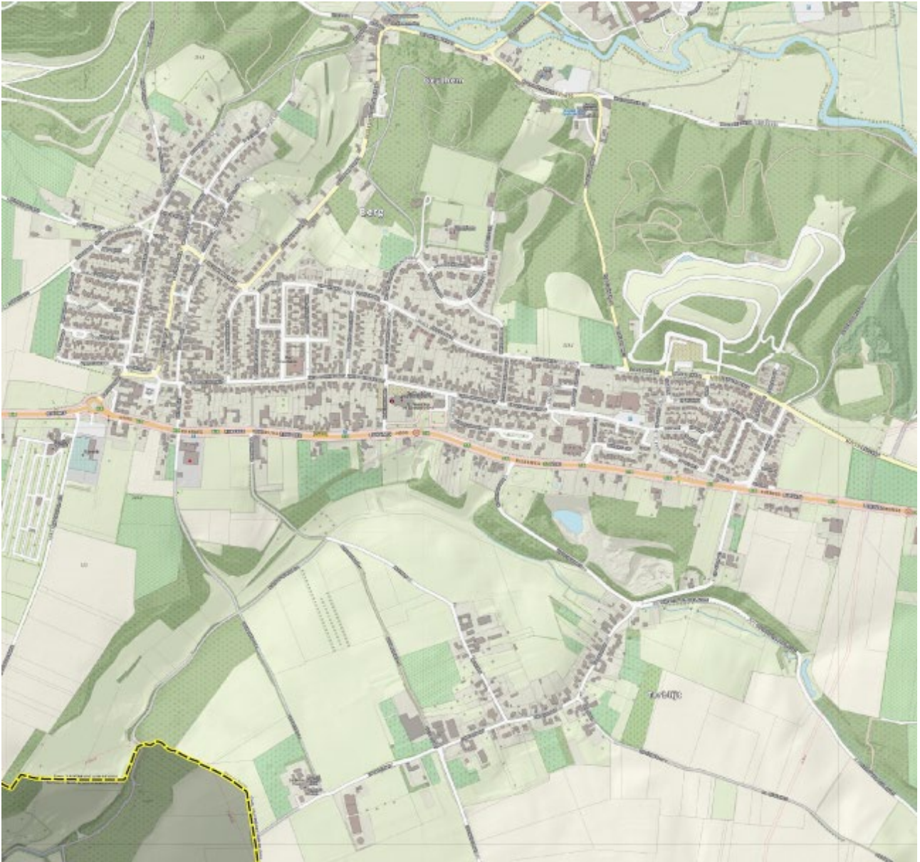
Figuur 2: Voorbeeld kaart voor kernen Berg en Terblijt

Kinderen die met hun ouders meekomen naar een bijeenkomst wordt gevraagd een tekening te maken van hoe hun woonplaats er over 10 jaar uitziet.