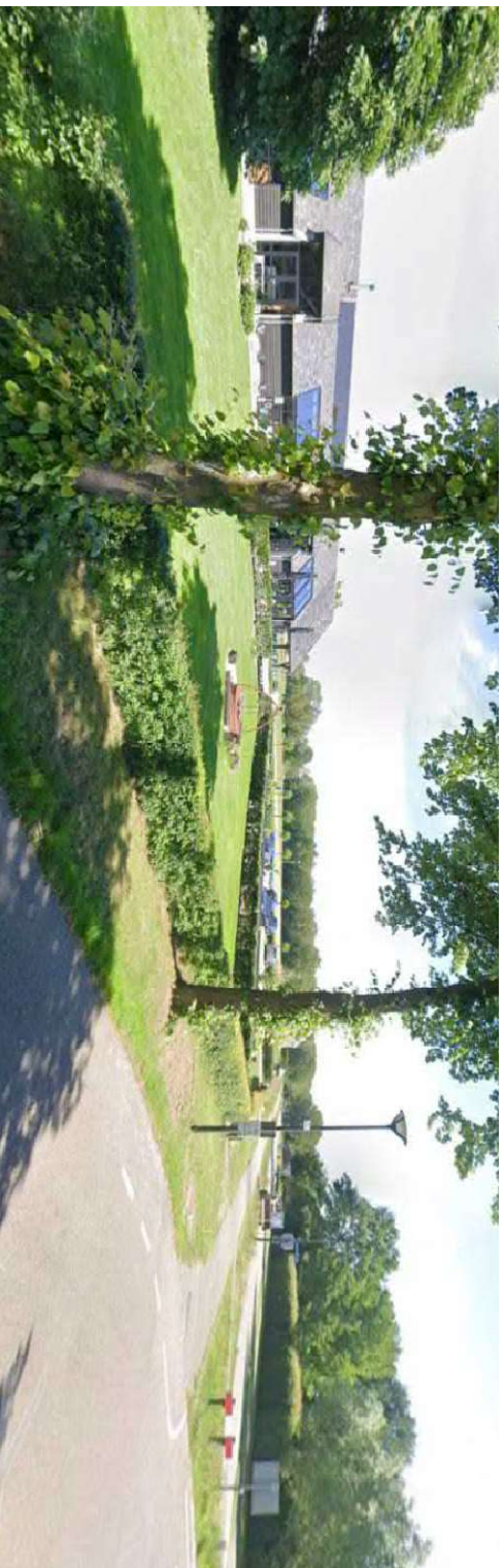
Deze afbeeldingen geven een beeld op het perceel ( streetview google ) gezien vanaf het Voor-Oventje en de Verbindingsweg