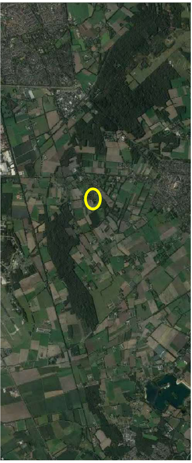
Deze afbeeldingen geven een beeld van de locatie van het plangebied