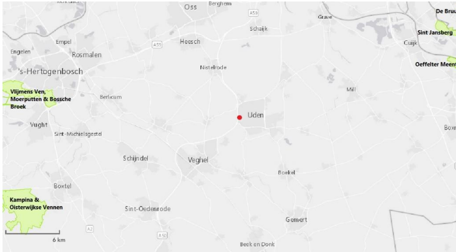
Figuur 4.2. Ligging van het plangebied (rode stip) ten opzichte van Natura-2000 gebieden (groen weergegeven).