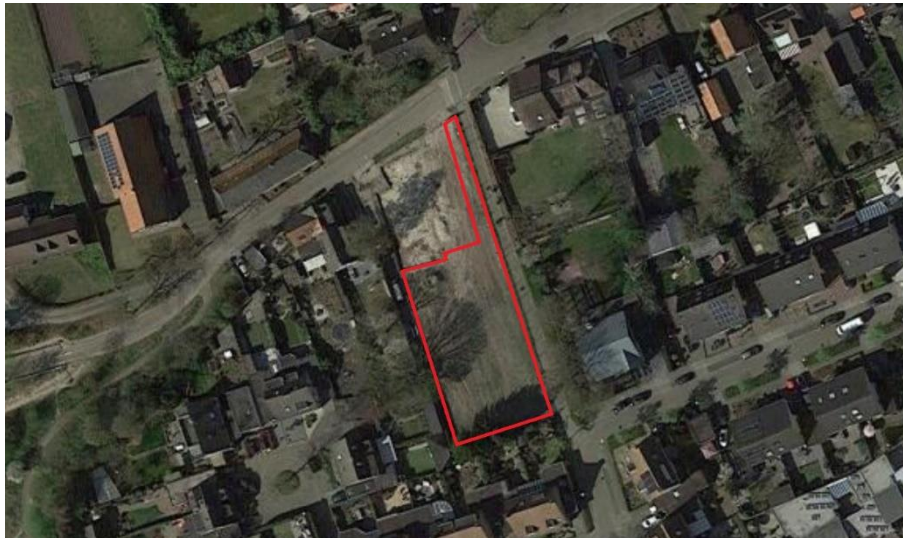
Figuur 4.1. Het plangebied (rood omlijnd).

Het plangebied (zie figuur 4.1 en de foto's op pagina 2) ligt in het oosten van de kern van Uden. Het bestaat uit 3 braakliggende percelen, aan de achterzijde van Oud Moleneind 11A. Tijdens het veldbezoek waren er al diverse bouwmaterialen aanwezig en was op de meeste plekken geen vegetatie meer aanwezig. In het plangebied komen soorten voor als paardenbloem, paarse dovenetel, grote brandnetel, vogelmuur, duizendblad, zachte ooievaarsbek, winterpostelein, hondsdrif, ridderzuring en klimop.