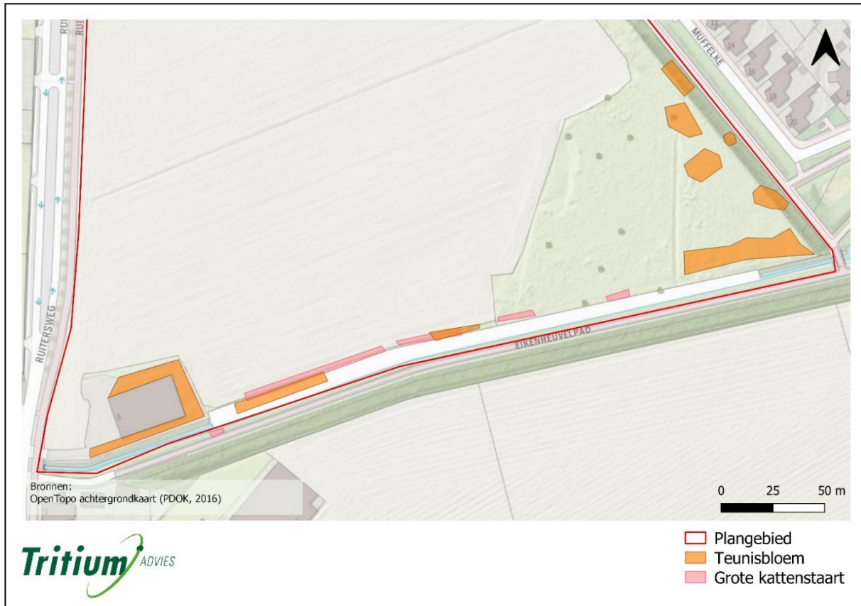
Figuur 3.6: Kaart met aanduiding van de locaties van de waardplanten, teunisbloem en grote kattenstaart, van de teunisbloempijlstaart.