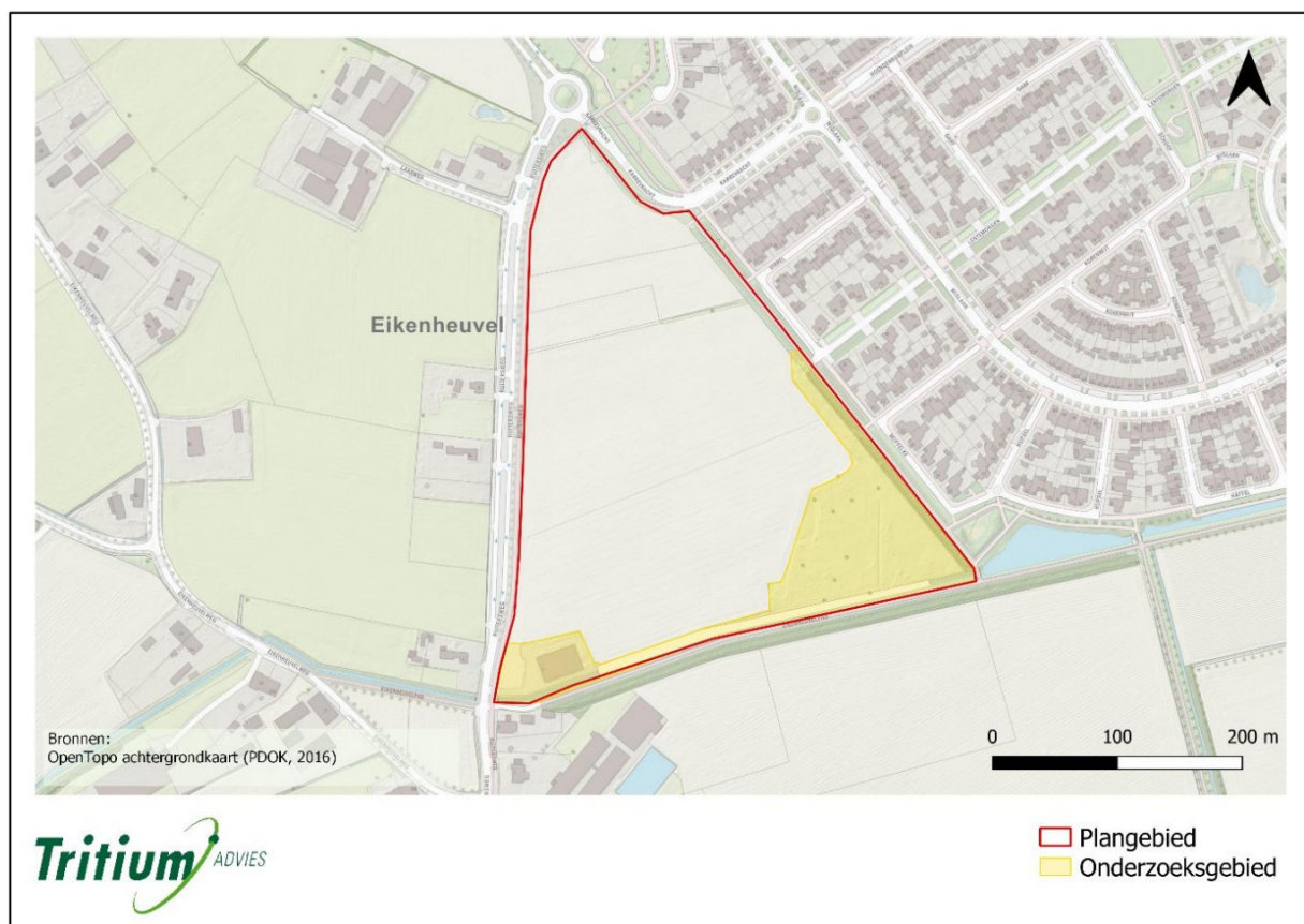
Figuur 2.1: kaart met de ligging van het plangebied (rood omlijnd) en het onderzoeksgebied (geel gearceerd).

In opdracht van de gemeente Maashorst is een aanvullend onderzoek naar de alpenwatersalamander, kleine marterachtigen, de steenmarter en de teunisbloempijlstaart uitgevoerd voor de locatie De Ruiters te Uden. Het voornemen bestaat om op deze locatie nieuwbouw te realiseren. De oppervlakte van het plangebied bedraagt circa 90.000 m 2 . De ligging van het plangebied betreft de kadastrale percelen 773, 946, 1495, 1496, 1497, 1498, 1879, sectie P, gemeente Uden. Het plangebied was in gebruik als akkerland. In de huidige situatie bestaat het plangebied uit braakliggend terrein met de aanwezigheid van bouwmaterialen en kruidenrijke begroeiing aan de randen. In het zuidelijk deel zijn een kruidenrijk grasland met solitaire bomen en braamstruweel en een te amoveren schuur aanwezig. Het in dit rapport beschreven onderzoek is uitgevoerd in het onderzoeksgebied (figuur 2.1).