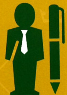
griffier is bij gesprek aanwezig