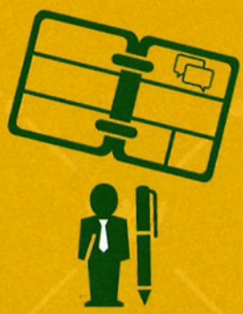
griffier plant gesprek in