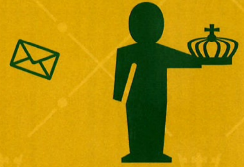
commissaris van de Koning