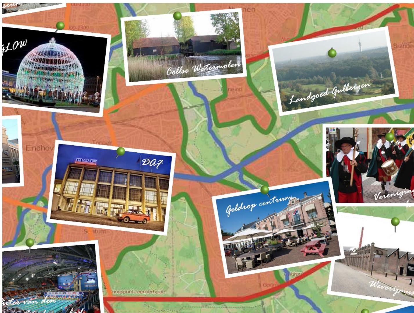
Uitsnede ecologisch-culturele kaart

De natuur en het buitengebied zijn altijd dichtbij: mozaïek stad – land, natuur en stedelijke massa zijn met elkaar verweven. Rust en ruimte is nog volop in regio aanwezig en een belangrijke kernkwaliteit.