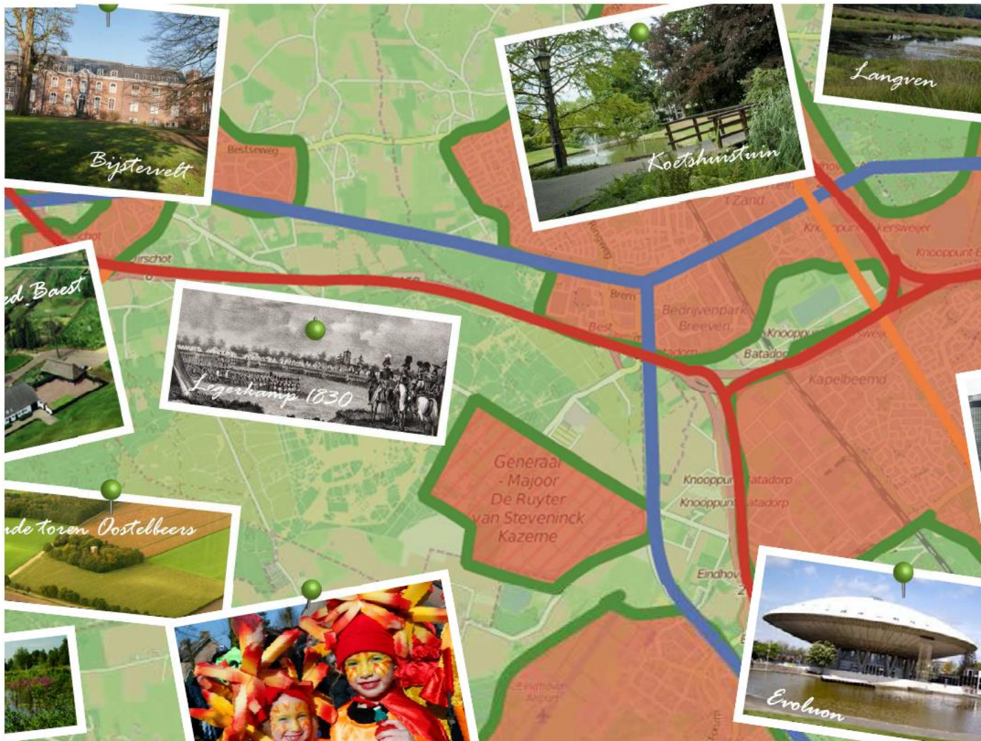
Uitsnede ecologisch-culturele kaart