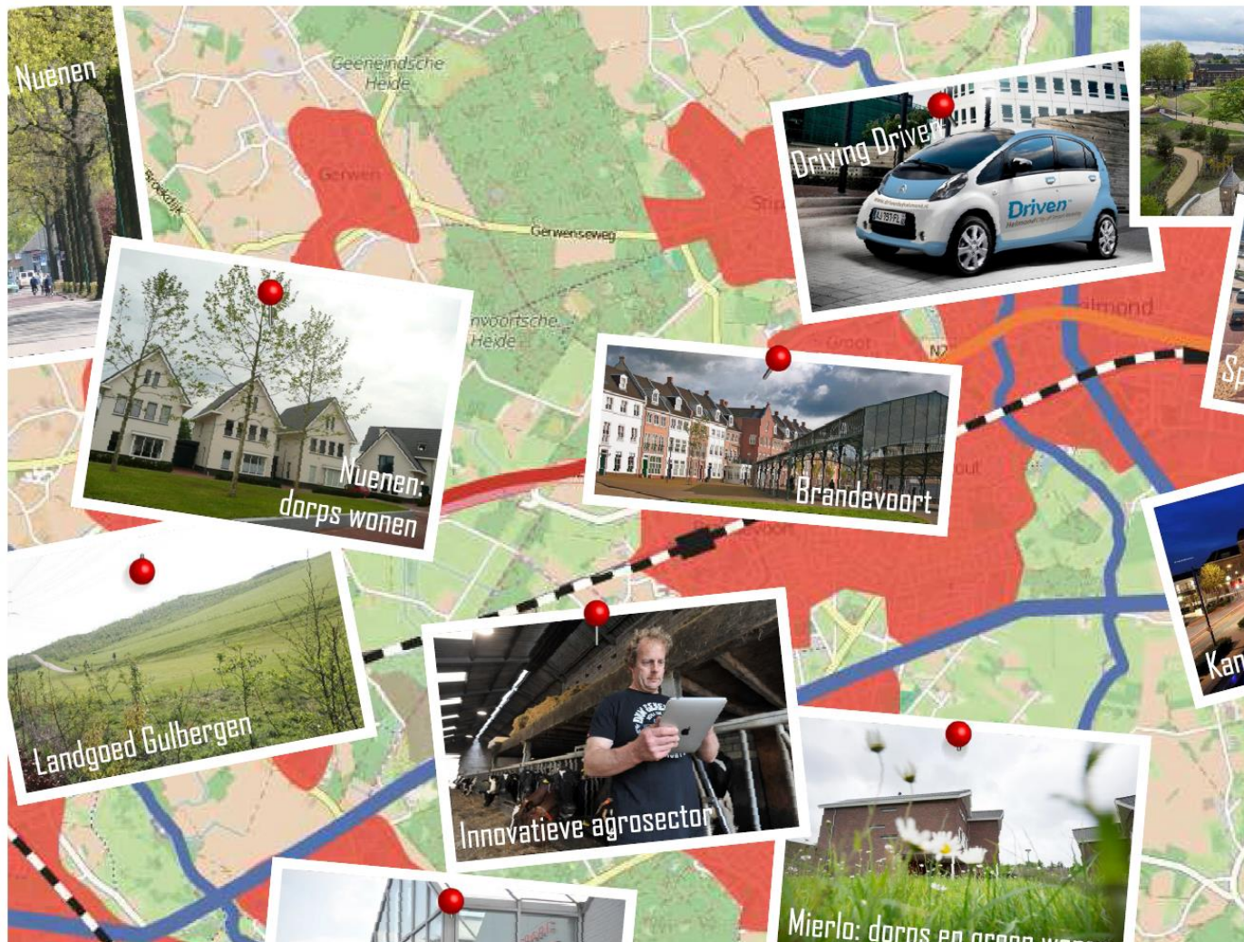
Uitsnede ruimtelijk-economische kaart

Ruimtelijk-Economisch vormt de regio stedelijk gebied het economisch hart van de Brainport. De vele campussen zijn een goed voorbeeld van technologie, innovatie en economische samenwerking. Onderwijs en maakindustrie profiteren van elkaars nabijheid.