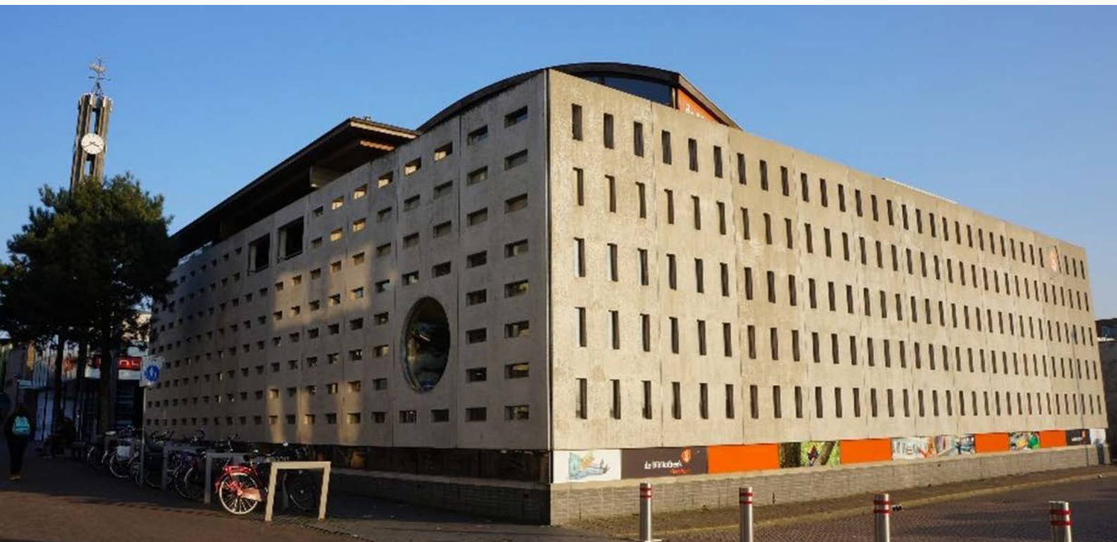
Afbeelding 4 Flevomeerbibliotheek.

“In Zeewolde kennen wij elkaar. Zeewolde is ons thuis, met ons open en weidse buitengebied, ons bos en ons water. Met onze sportiviteit en onze evenementen. We gaan weg om te studeren en komen terug om te settelen.”