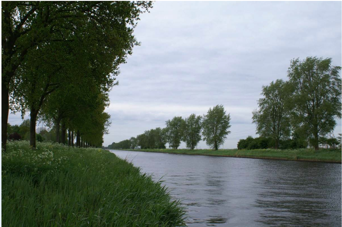
Afbeelding 1 Zicht op de Hoge Vaart.