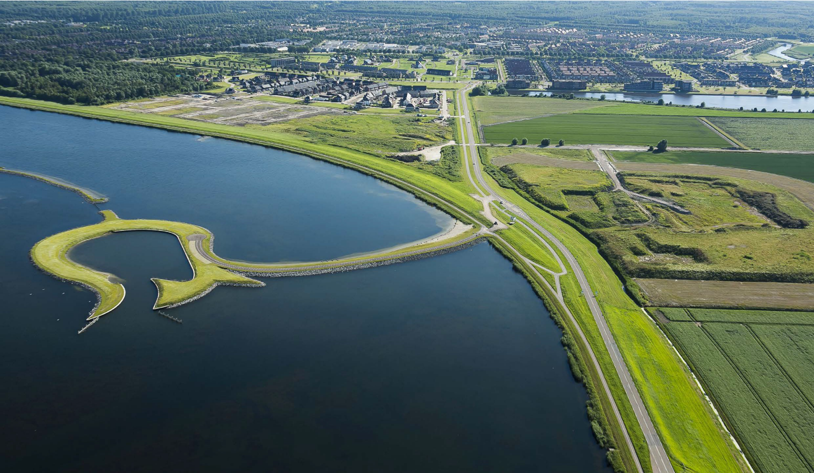
Afbeelding 6 Tulpeiland.

De natuur van Flevoland is ontstaan achter de tekentafel en uitgegroeid tot ruige nieuwe wildernissen. In de grootse loofbossen en het weidse water gaat de natuur haar eigen gang en met de jaren wordt het bos dichtter, groener en indrukwekkender. Je kan hier struinen en slapen in het bos. Spot bijzondere vogels zoals de zeearend en kom oog in oog met reeën, herten, vossen, wilde paarden of bevers; onze eigen 'big five'. Beleef de ongerepte natuur van Zeewolde. Het Hulkensteinse bos, de Stille kern en Harderbroek met de Biezenburcht zijn voorbeelden van de ingerichte natuur. Ook Tulpeiland kan hierbij niet vergeten worden.