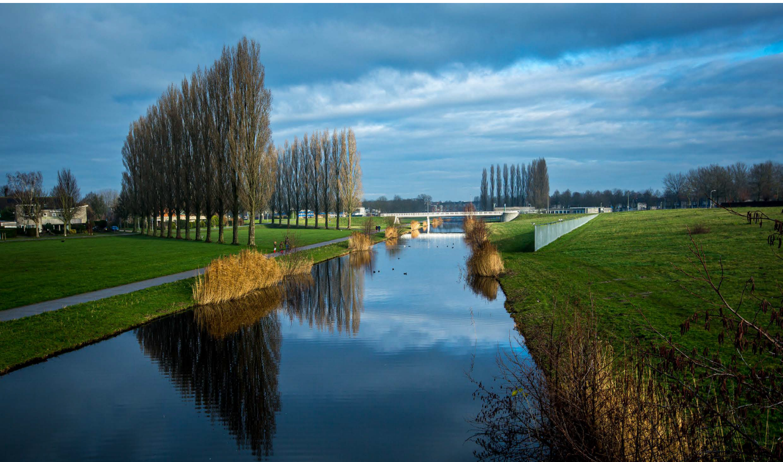
Afbeelding 8 Uitzicht op het Weteringspark met het kunstwerk 'Sealevel'.