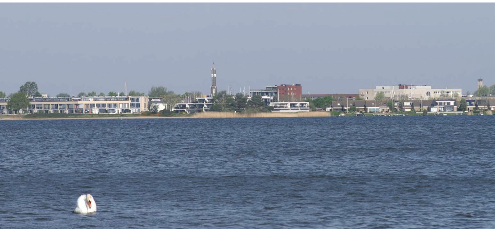
Afbeelding 5 Het dorp aan de Wolderwijd.

Anno 2025 is na 40 jaar bouwen Zeewolde tot een dorp met ruim 24.000 inwoners uitgegroeid. Tussen het water, de weiden en het bos is in korte tijd een dorp verrezen en een bloeiende gemeenschap ontstaan. Zeewolde is niet alleen een unieke plek om te wonen en te werken; het is ook gemaakt om te recreëren. De uitgestrekte en bijzondere natuur, de stranden, het dorpse karakter, de hang naar eerlijke producten en de vele watersportmogelijkheden maken dit aantrekkelijke gebied tot een vrijetijdsbestemming voor jong en oud.