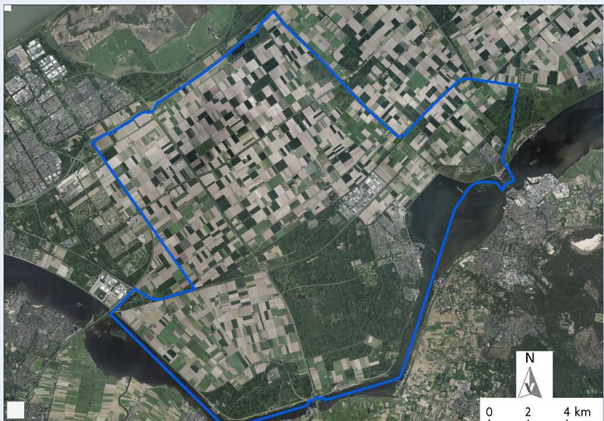
Afbeelding 2 Gemeentegrens op de Meest Actuele Luchtfoto.