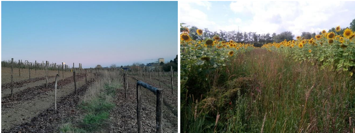
Figuur 19. Links. Zicht op de nieuwe aanplant en swale. Rechts. Zicht op de groenbemester met de swale die er door loopt.

De hoge kruidachtige begroeiing is ook een zeer goede habitat en schuilplaats voor nuttige organismen. Zweefvliegen, bestuivers, oormormen, amfibieën en tal van andere soorten zullen hiervan profiteren.