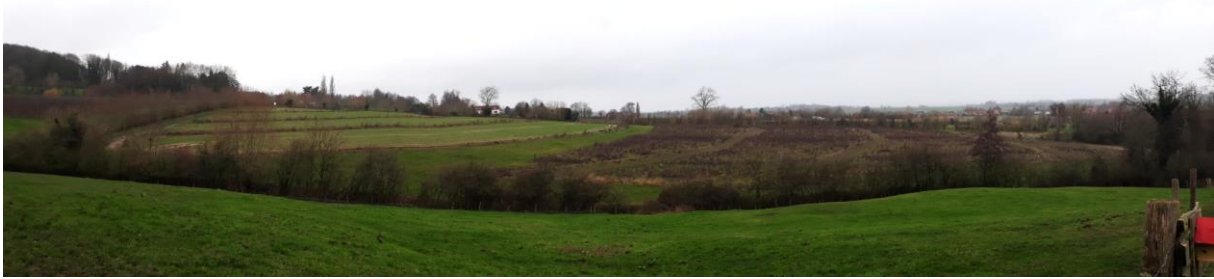
Figuur 9. Contourboslandbouw als corridor en visueel aantrekkingspunt in het complexe natuur-, landbouw- en belevingslandschap te Heuvelland (2020).

de meeste landbouwlandschappen aantrekkelijk(er) te maken voor de verschillende gebruikers van het landschap.