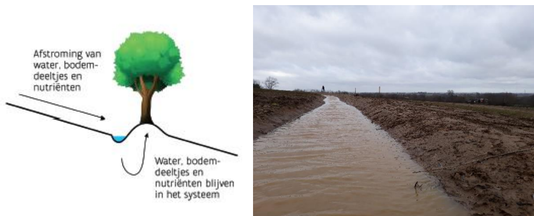
Figuur 1. Links: Werkingsprincipe van een swale of greppel-berm structuur. Rechts: opvang van water, sediment en nutriënten in een pas aangelegde swale in Westouter (Heuvelland).

In de greppel wordt het afstromende water opgevangen, waarna het kan infiltreren in de bodem (zie Figuur 1 ). Ook het sediment en de nutriënten die aanwezig zijn in het water kunnen op die manier infiltreren en komen niet in het oppervlaktewater terecht, waar ze kunnen leiden tot eutrofiëring. Stroomafwaarts van een swale zal het debiet van afstromend water lager zijn, waardoor er minder erosie is. De greppels kunnen ook zodanig zijn aangelegd dat het teveel aan water wordt weggeleid naar een reservoir, waar het beschikbaar blijft voor later gebruik (Dautrebande 2003, Shepard 2013).