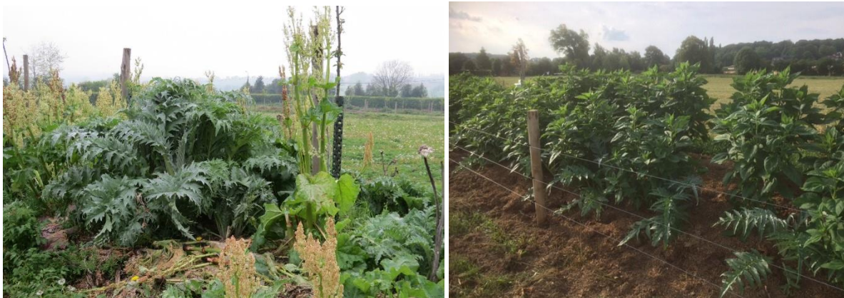
Figuur 7. Artisjok, rabarber en aardpeer: enkele van de vele mogelijke teeltkeuzes op de bermen (Heuvelland 2017).

Voor een optimale invulling moet altijd rekening gehouden worden met de lokale context. Zo is munt een plant die goed gedijt in natte omstandigheden, waardoor het deel van de berm net naast de greppel een geschikte standplaats is. Daslook heeft een voorkeur voor neutrale tot licht kalkrijke bodems, dus kan bijvoorbeeld niet gecombineerd worden met het meeste kleinfruit (Crawford 2010). Een goede opvulling van de berm vereist dus een doordachte aanpak, maar kan tegelijkertijd een brede waaier aan mogelijkheden bieden. De hierboven vermelde soorten maken immers maar een fractie uit van de gewassen die op de berm kunnen geteeld worden. Naast de abiotische en biotische kenmerken van de swales moet bij de uiteindelijke selectie van de gewassen ook rekening gehouden worden met afzetmogelijkheden, oogstbaarheid etc.