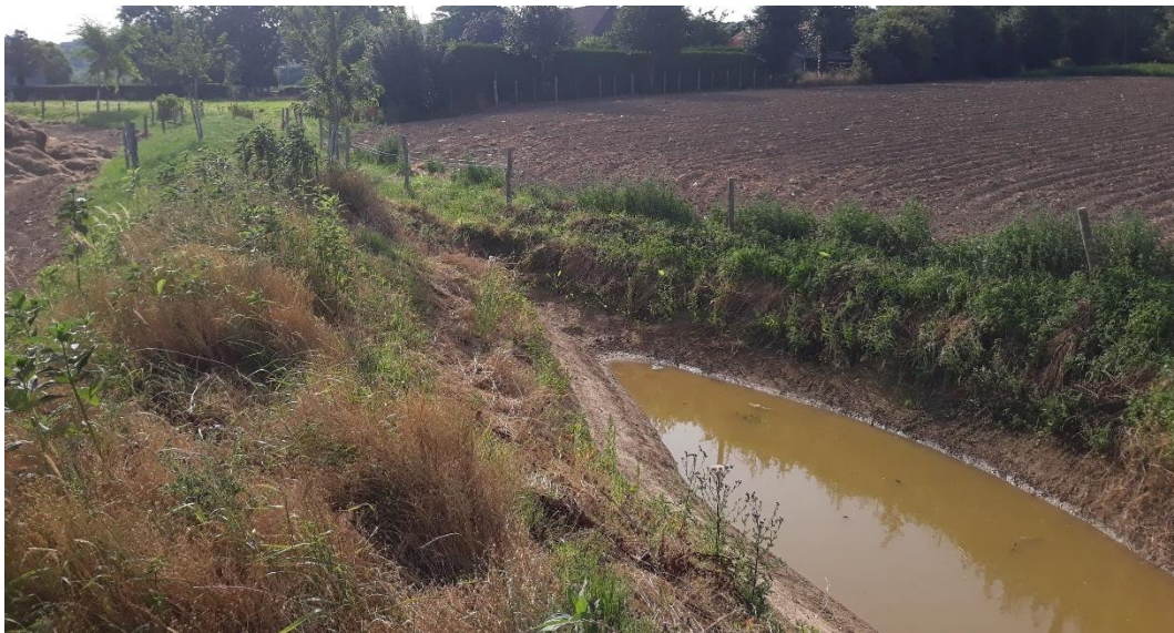
Figuur 14. Verbreding van de greppels op de plaatsen waar de hoogtelijn “bol” staat.

Op de vraag wat hij sinds de eerste ervaringen anders aanpakt, antwoordt Rik dat hij nu zou suggereren om het minder gecompliceerd aan te pakken: minder grote bermen te maken (zachtere helling) en geen echte greppel meer te graven. Eerder stelt hij voor om een kleine toplaag van de bodem aan de benedenzijde af te schrapen en dit als kleine berm op te werpen. Dit kan aangevuld worden met mulch, compost en op termijn ook aarde door de beweging van de schijveneg langsheen de contour. Geleidelijk ontstaat zo een plateau. De zachtere helling zorgt ervoor dat de berm nog met een klepelmaaier gemaaid kan worden. Een alternatief voor de aanleg van een beperkte greppel, is eventueel ook het gebruik van een greppelfrees in plaats van een kraantje voor het graafwerk. Daarnaast zoekt Rik vooral hoe de bermen nog meer benut kunnen worden als geleidingsroute voor het roterende vee (stootbegrazing). Waar het vee zich van het ene naar het andere perceel verplaatst, zou dit via de bermen kunnen verlopen. Een idee daarbij is om op de bermen meer hazelaars (als voederbomen) te planten.