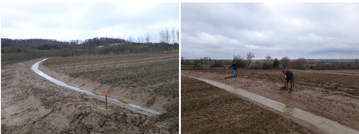
Figuur 10. Links: pas aangelegde swale met de markeringspaaltjes van de uitgezette hoogtelijnen nog zichtbaar. Rechts: aanplant van de bomen op de berm (Heuvelland 2019).

Bepaalde materiaalkosten kunnen erg duur uitkomen als men effectief zelf nieuwe toestellen aankoopt. Echter, het uitmeten van de hoogtepunten en uitzetten van de contourlijnen kan tegen een relatief beperkte kost, als je het benodigde materiaal kan huren en eventueel ook (een deel van) het werk zelf uitvoert. Belangrijk voor een goed resultaat is wel dat je heel nauwkeurig te werk gaat.