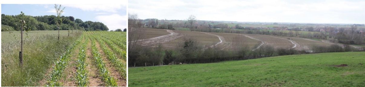
Figuur 16. Agroforestry op de percelen van ANB in Heuvelland. Links: perceel 1 met een klassiek alley cropping patroon van parallelle bomenrijen die hellingafwaarts aangeplant zijn. Rechts: perceel 2 met toepassing van contourboslandbouw.

Twee percelen zitten vervat in agroforestry. Een eerste perceel van 2,2 ha werd aangelegd in 2016, waarbij de bomenrijen loodrecht op de helling staan, van boven naar beneden.