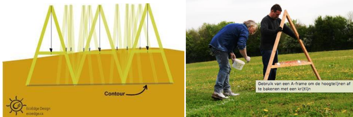
Figuur 4. Gebruik van een A-frame om de hoogtelijnen af te bakenen. (Foto rechts Jeroen Watté, Wervel 2014 CC BY-SA).

Daarnaast kan ook gebruik gemaakt worden van een laser om de contourlijnen uit te zetten. Dit systeem is duurder dan het A-frame, maar het is sneller en eenvoudiger om te doen met één persoon. Het lasersysteem bestaat uit twee delen: vanaf een driepoot wordt een lasersignaal uitgestuurd en dit wordt opgevangen door een lezer op een meetstaaf. De lezer op de meetstaaf bevindt zich op dezelfde hoogte als de bron van het lasersignaal. Het is belangrijk om de driepoot perfect horizontaal te plaatsen, hiervoor is een afzonderlijke indicator (meestal een waterpas) voorzien. Wanneer de lezer op precies dezelfde hoogtelijn (en dus hoogte) als de bron van het signaal staat, klinkt een signaal.