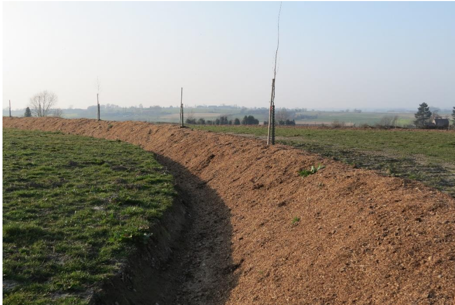
Figuur 11. De pas aangelegde swales met een dikke mulchlaag op het perceel van Rik Delhaye. Situatie 2015.