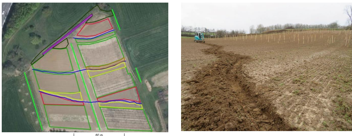
Figuur 18. links. Opdeling zones Natuurlijk Fruit. Rechts. De aanleg van een swale.

Om erosie te vermijden, staan de fruitrijen oost-west georiënteerd. Op vlak van lichtcompetitie is deze oriëntatie natuurlijk niet ideaal. Daarom combineert men afwisselend steeds hoge fruitsoorten met lage fruitsoorten. Voorbeelden hiervan zijn herfstframboos gecombineerd met zomerframboos en braam gecombineerd met komkommer en rode biet.