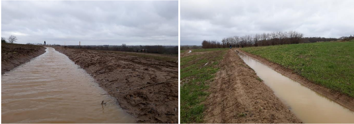
Figuur 8. Opvang en infiltratie van afstromend water en sediment in een pas aangelegde swale (Heuvelland 2019).

Tot dusver hadden we het enkel over het effect van de fysieke structuur van de swale. De beplanting op de berm van de swale speelt natuurlijk ook een betekenisvolle rol in de bijdrage aan erosiebestrijding. Zo bevorderen de wortels van de bomen of andere vegetatie de infiltratie van het water, en versterken ze de structuur van de berm. Een dicht beplante berm zal, net als bij andere types bufferstroken, een bijkomend vertragend effect hebben op het afstromend water en daardoor erosie verder reduceren.