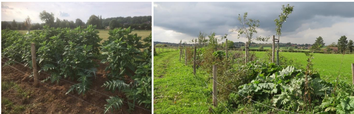
Figuur 13. Productie van aardpeer (links) en rabarber, artisjok en een mix van kruidachtigen (rechts) op de bermen van het contourboslandbouwsysteem bij Rik Delhaye.

Verder is de landschappelijke waarde en het functioneren als corridor van groot belang.