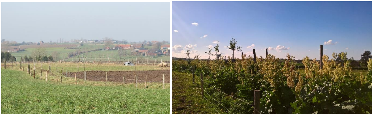
Figuur 5. In combinatie met beweiding is een goede afscherming van de swales cruciaal (Heuvelland 2017).

In de zone tussen twee swales kunnen dieren gehouden worden op een weiland. De mogelijkheden worden hier doorgaans niet beperkt of gewijzigd door de aanwezigheid van de swales, maar een goede afscherming van de swales is cruciaal, zeker als op de swales zelf bomen en/of andere gewassen staan. Wanneer runderen of ander vee in de gracht of op de berm lopen, compacteren ze de bodem wat de infiltratie bemoeilijkt. Bovendien kunnen ze de jonge bomen en andere beplanting beschadigen. De noodzakelijke afscherming kan een serieuze investering betekenen; swales in combinatie met runderen op weiland wordt dus niet als een evidentie beschouwd. Anderzijds biedt dit ook mogelijkheden tot bv een omweidingsysteem waarbij de dieren regelmatig van zone veranderen, met de swales zelf als een afbakening van die zones.