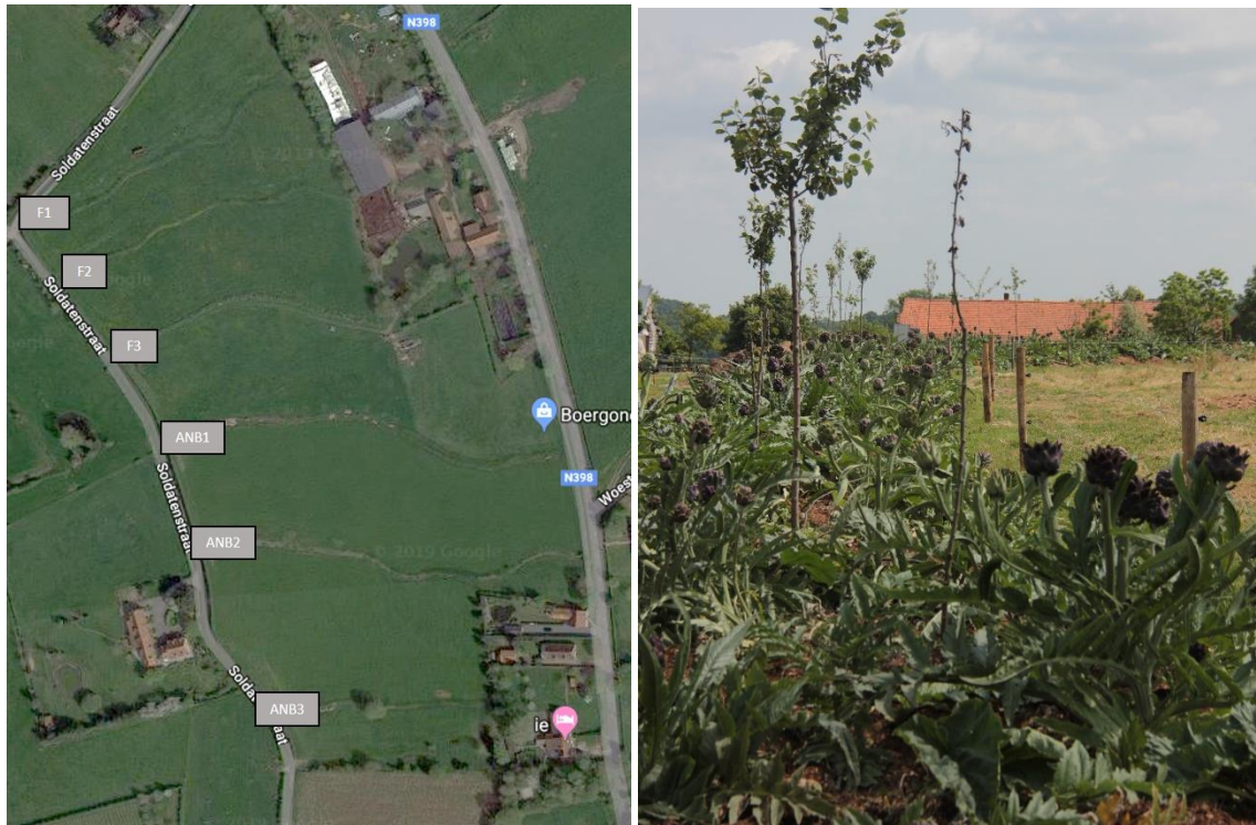
Figuur 12. Contourboslandbouw op het bedrijf van Rik Delhaye. Links overzicht van de swales. Rechts: beeld van de aanplant van fruitbomen en onderetage met artisjok en rabarber op swale F3.