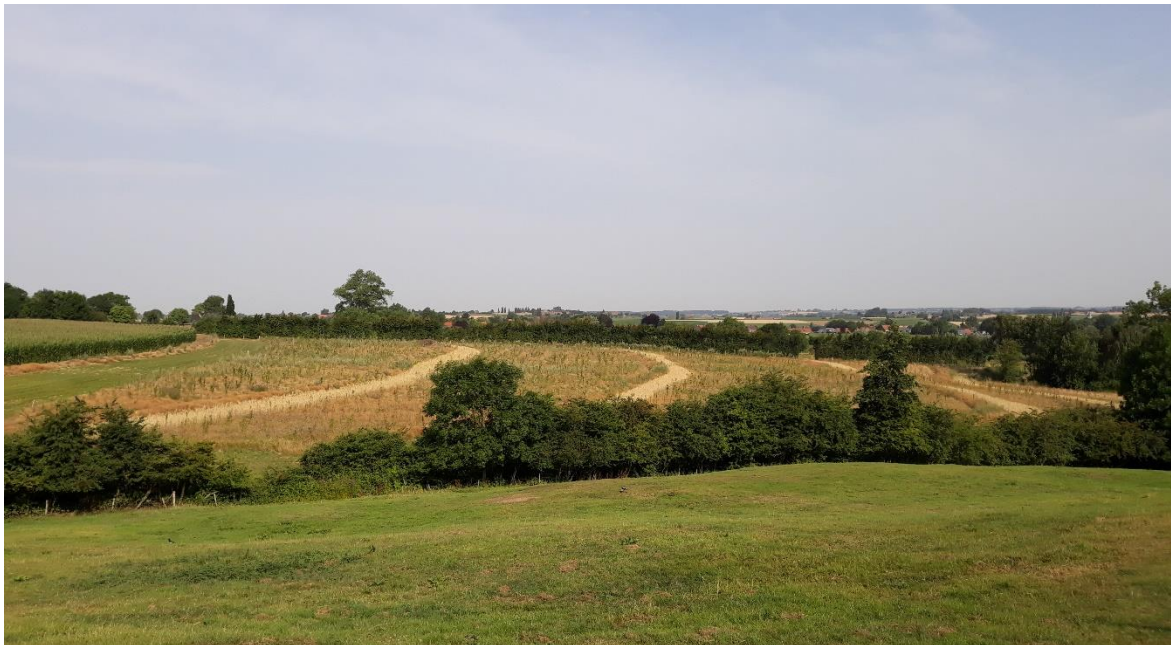
Figuur 15. Contourboslandbouw op de percelen van ANB in Heuvelland. De swales liggen op 2,5 m hoogteverschil van elkaar. Op het bovenste gedeelte wordt tussen de swales reguliere landbouw toegepast, het onderste gedeelte werd tussen de swales bebost met bomen en struiken. Situatie juli 2019.

Op de flanken van de Rodeberg werden initiatieven genomen om erosie tegen te gaan en de biodiversiteit en de landschappelijke waarde te verhogen, met respect voor het landbouwkundig gebruik. In een unieke samenwerking tussen ANB, enkele landbouwers en een hele reeks andere actoren waaronder ILVO, INBO en Regionaal Landschap Westhoek, werden langs en op landbouwpercelen greppels gegraven, die beplant werden met houtproducerende bomen en waar de natuur nu haar gang kan gaan. Men liet zich hierbij inspireren door het werk van pionierlandbouwer Rik Delhaye, die als eerste in Heuvelland met deze bijzondere vorm van boslandbouw aan de slag ging. De grachten en bermen bij contourboslandbouw zorgen ervoor dat er minder water en bodem wegspoelt. Op die manier kan men ook verdroging op de landbouwpercelen verminderen. Bovendien kunnen de bomen naast de biodiversiteits- en landschappelijke waarde ook een productiefunctie hebben. Een heuse win-win dus voor landbouw én natuur.