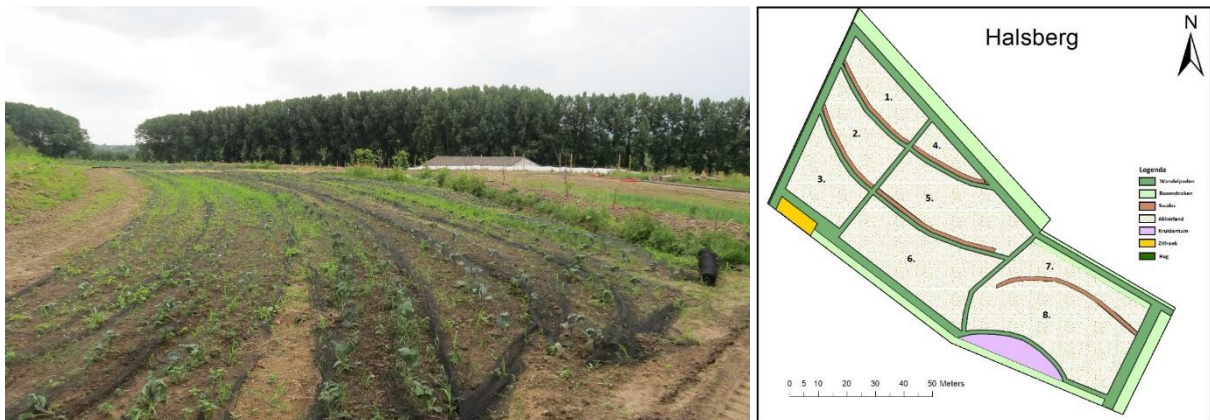
Figuur 6. Blokken met groentenbedden (genummerd) en oogstpaden (groen) volgen de recent aangelegde swales (bruin) op een hellend perceel van Den Halsberg in Gavere (2018).

gewassen, bomen en struiken op de swales (een deel van) het ruimte- en opbrengstverlies compenseren. Zie verderop. Op kleinschaliger groentenbedrijven, zeker in situaties met bv zelfpluk (CSA bv), stellen we vast dat dit niet noodzakelijk een probleem vormt, maar ingepast kan worden in de perceelsindeling, bv met een pad langsheen de swale. Aan de ene kant is er dan de swale met bv meerjarige gewassen, kleinfruit, bomen, ... en aan de andere kant liggen dan bv groentenbedden. Naargelang de oriëntatie van het perceel en de swales, kan dergelijk pad ook al de grootste schaduwimpact opvangen. Ook op grotere perceelsblokken met akkerbouw of grootschaliger groentenproductie, kan de zone naast de swales soms dienen als toegangsweg of keerpunt voor machines.