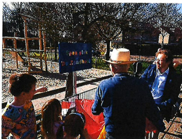
De opening van speelplek 'De Zandhoek' op 29 maart jl.

Samen met kinderen en omwonenden van de speelplek aan de Alsemlaan zijn in het najaar van 2018 de uitgangspunten voor de herin te richten speelplek aan de Alsemlaan geformuleerd. Op basis daarvan is de speelplek in maart 2019 heringericht naar een speelplek met natuurlijke elementen. Op 29 maart opende wethouder van Holstein samen met de kinderen en omwonenden de heringerichte speelplek die de naam 'De Zandhoek' kreeg.